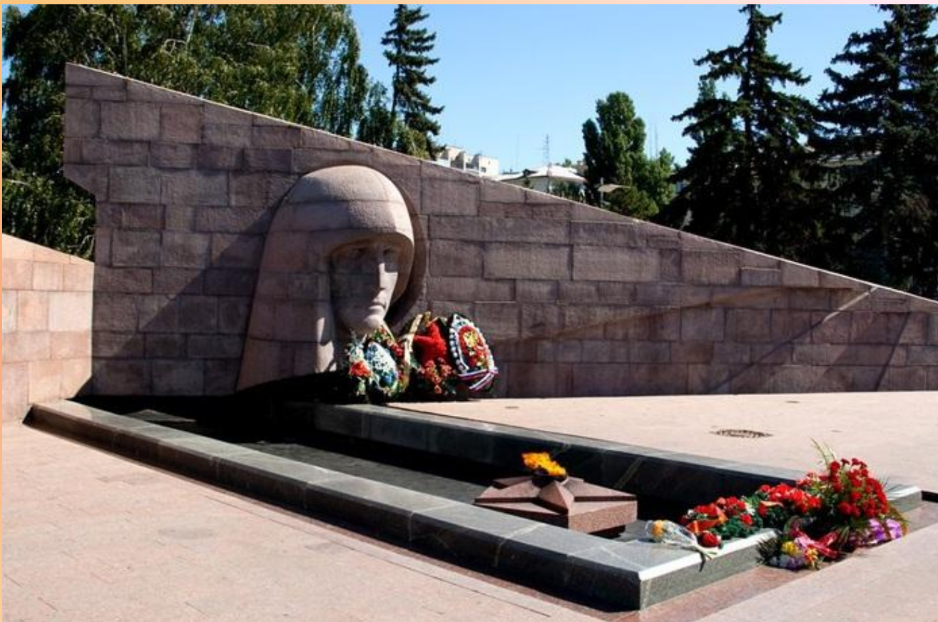
Памятник воинам, погибшим в Великой Отечественной войне.