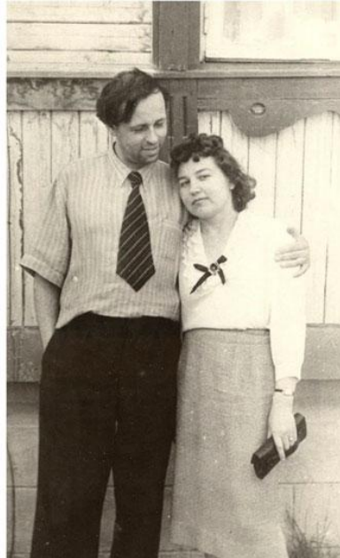
Андрей Сахаров с женой у своего дома на Объекте