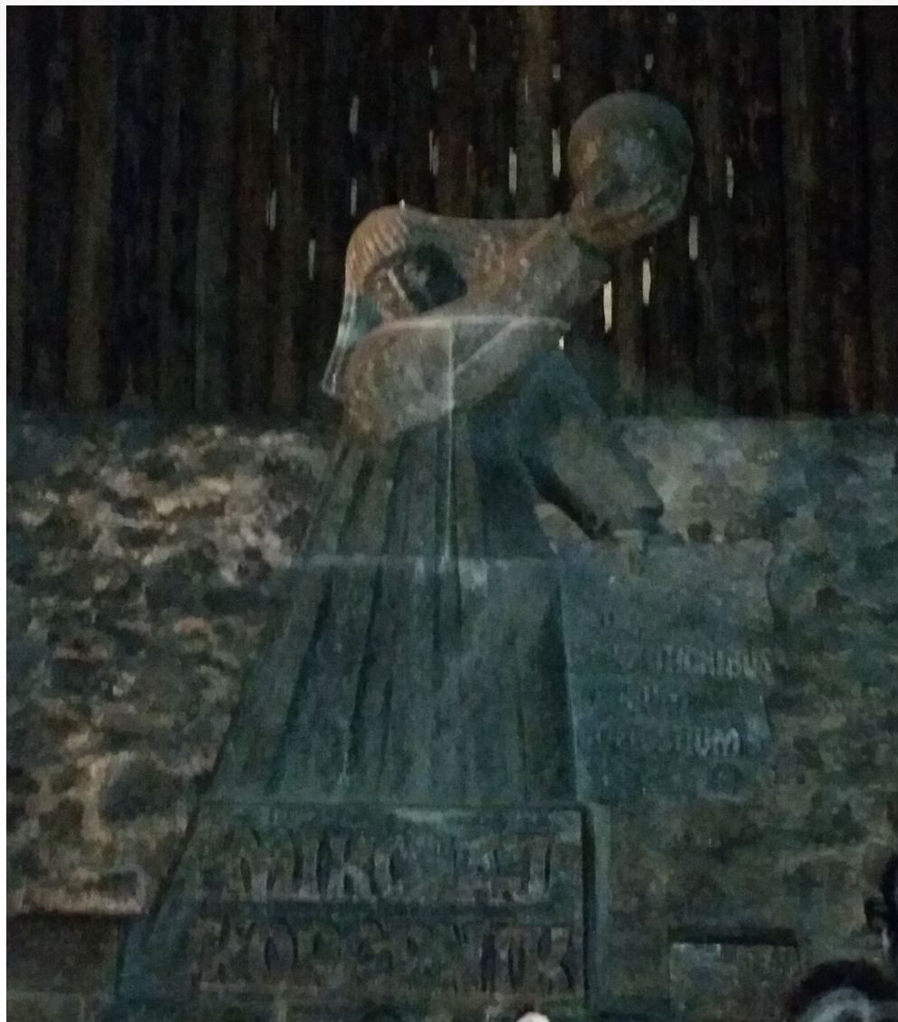
• Николай Копёрник •