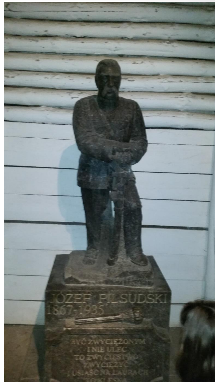
• Юзеф Пилсудский