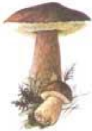
БЕЛЫЙ ГРИБ (БОРОВИК)