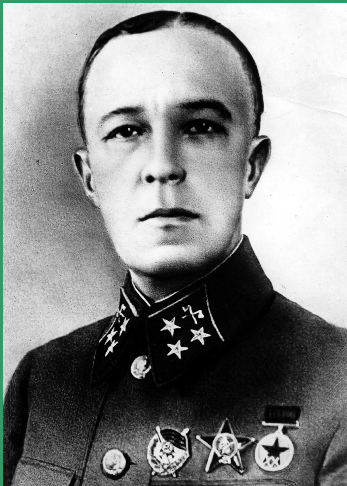
Карбышев Дмитрий Михайлович