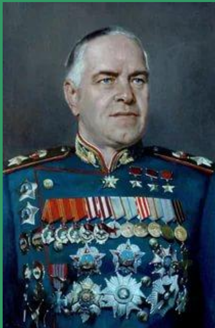
Жуков Георгий Константинович