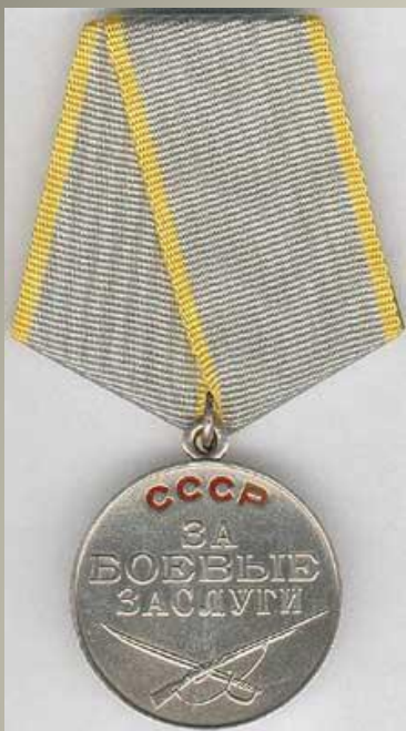
Медаль «За боевые заслуги»