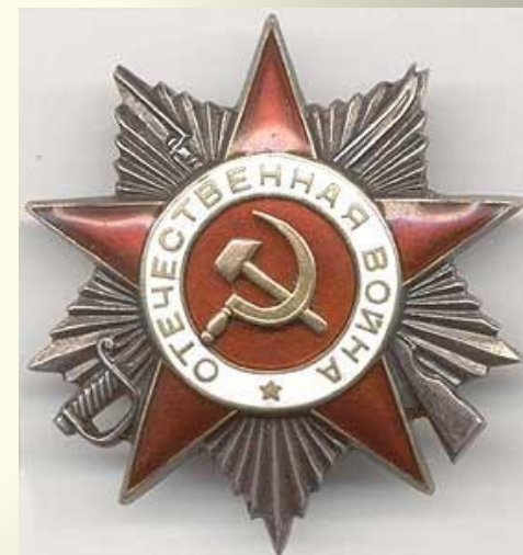
Орден Отечественной войны, 2 степени