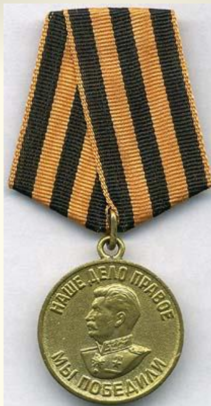
Медаль «За Победу над Германией в Великой Отечественной войне 1941 – 1945