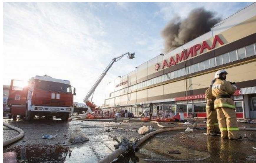
Пожар в торговом центре «Адмирал»