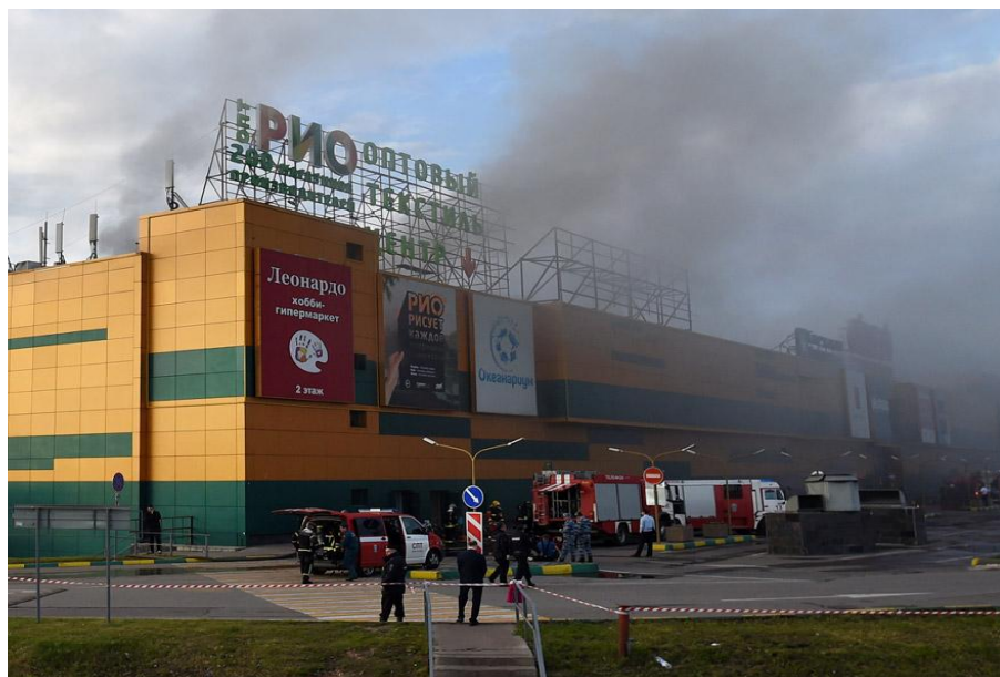
Пожар в торговом центре «РИО»