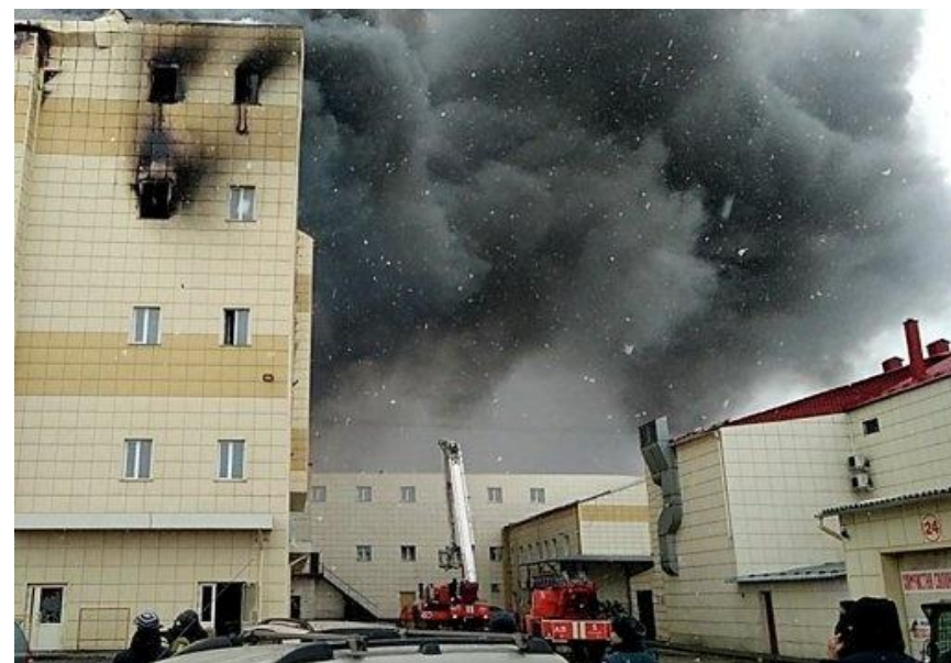
Пожар в торговом центре «Зимняя вишня»