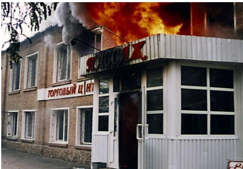
Пожар в торговом центре «Пассаж»

Для анализа основных причин возникновения пожаров, гибели и травмирования людей в торгово-развлекательных комплексах, необходимо произвести анализ наиболее крупных пожаров на данных объектах.