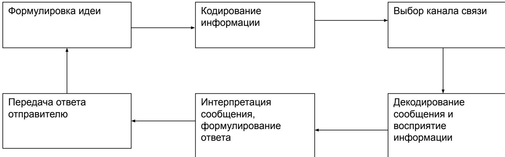
Рисунок. Модель процесса коммуникации