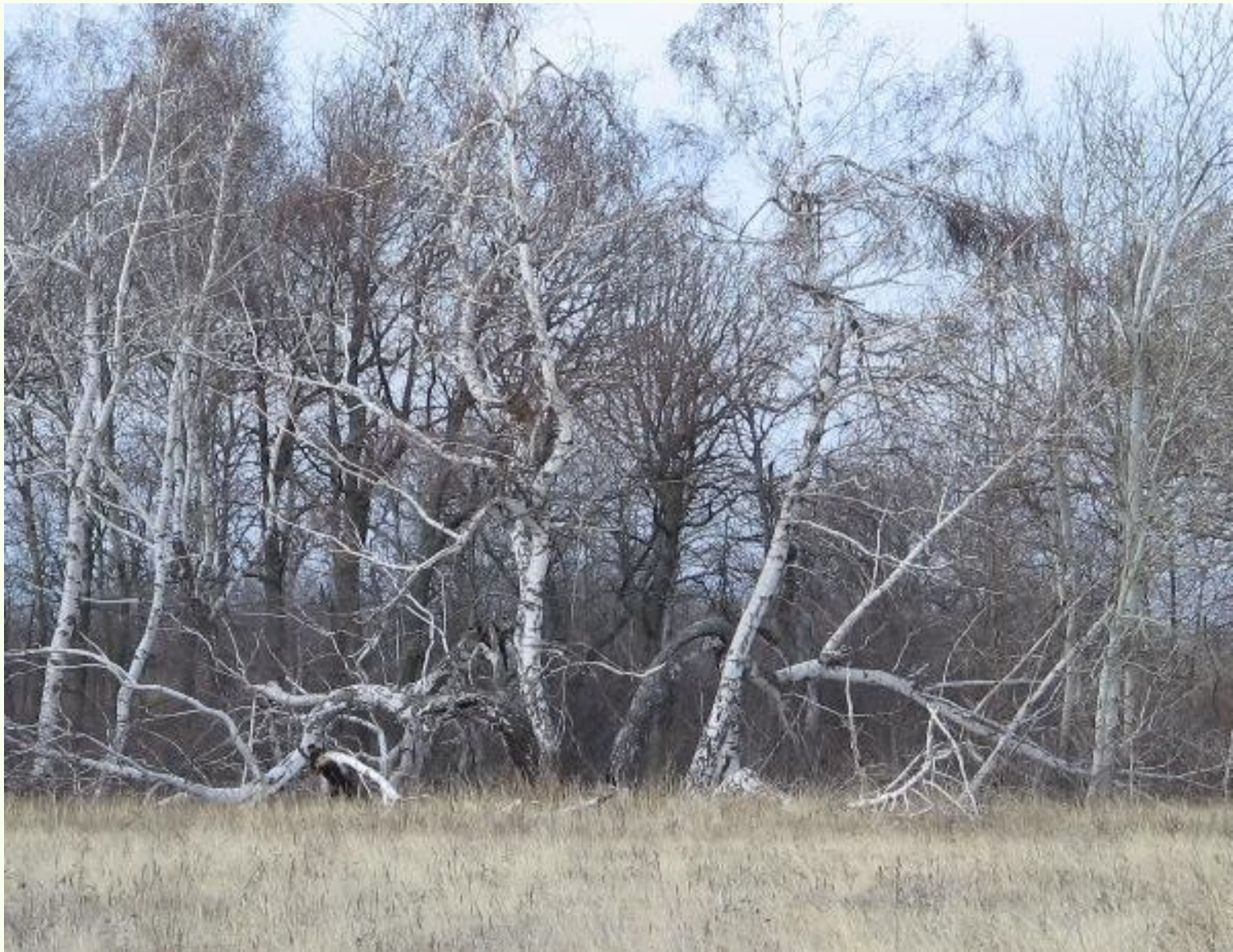
Рис.1. Последствие шаровых молний