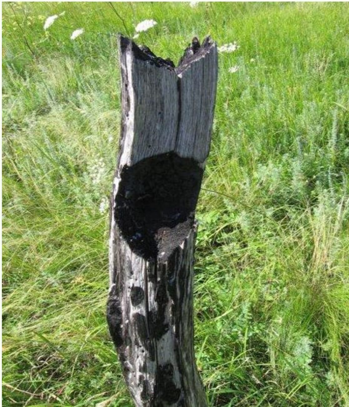
Рис.2. Последствие шаровых молний