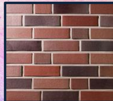
Кирпичны й стежок