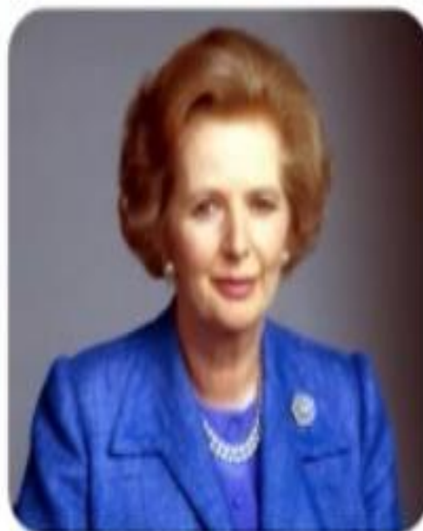
Ма́ргарет Тэ́тчер — премьер-министр Великобритании (1979-1990 гг.)