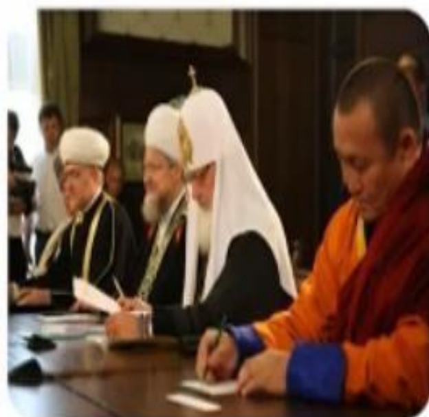
Первый Президент Н.А. Назарбаев с участниками съезда, 2003 г.