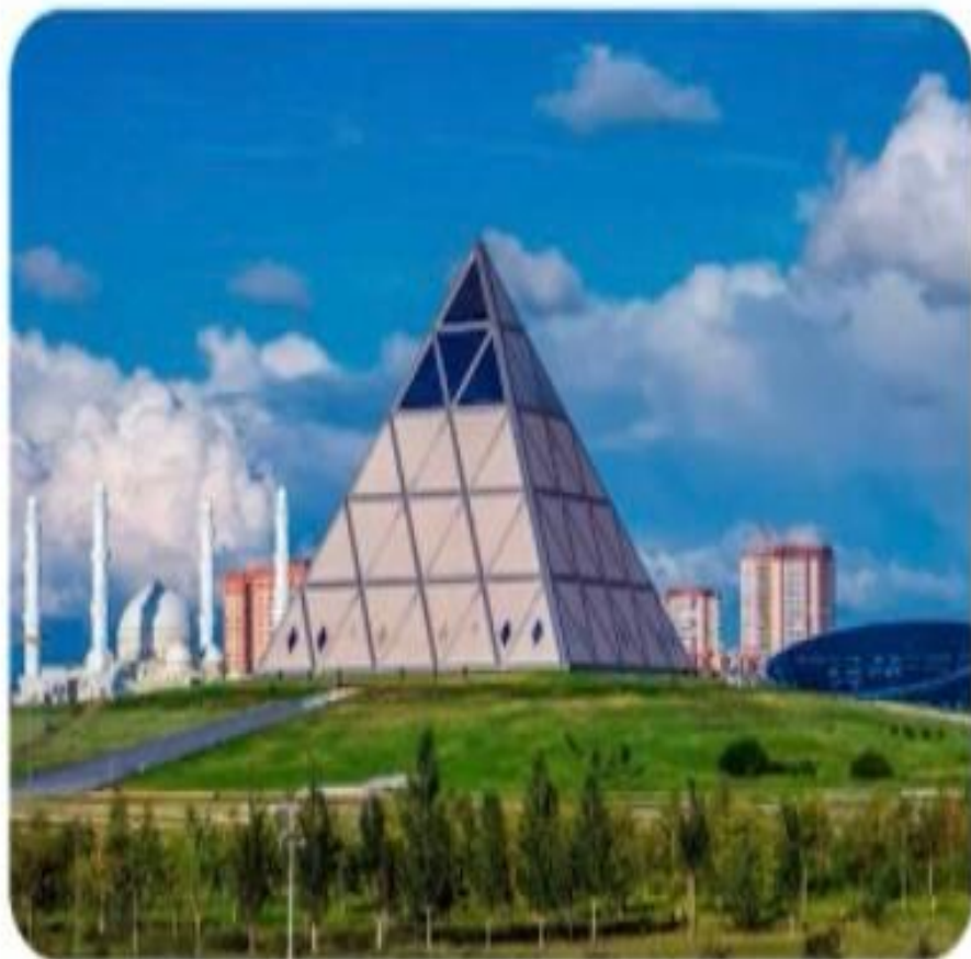
Дворец мира и согласия, г. Нур-Султан

Международный центр культур и религий – организация, участвующая в осуществлении диалога цивилизаций. Важной миссией этого центра является пропаганда опыта Казахстана на международной арене по укреплению межконфессионального согласия и единства народов.