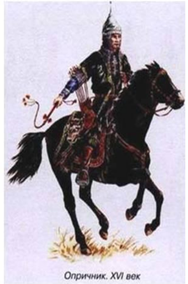
Опричник. XVI век

Черная одежда грубого сукна, прикрепленная к седлу собачья голова и метла, означало, что слуги-опричники подобно псам будут грызть крамольников и выметут всю измену из Московского государства. Всем своим видом опричники наводили ужас на встречных.