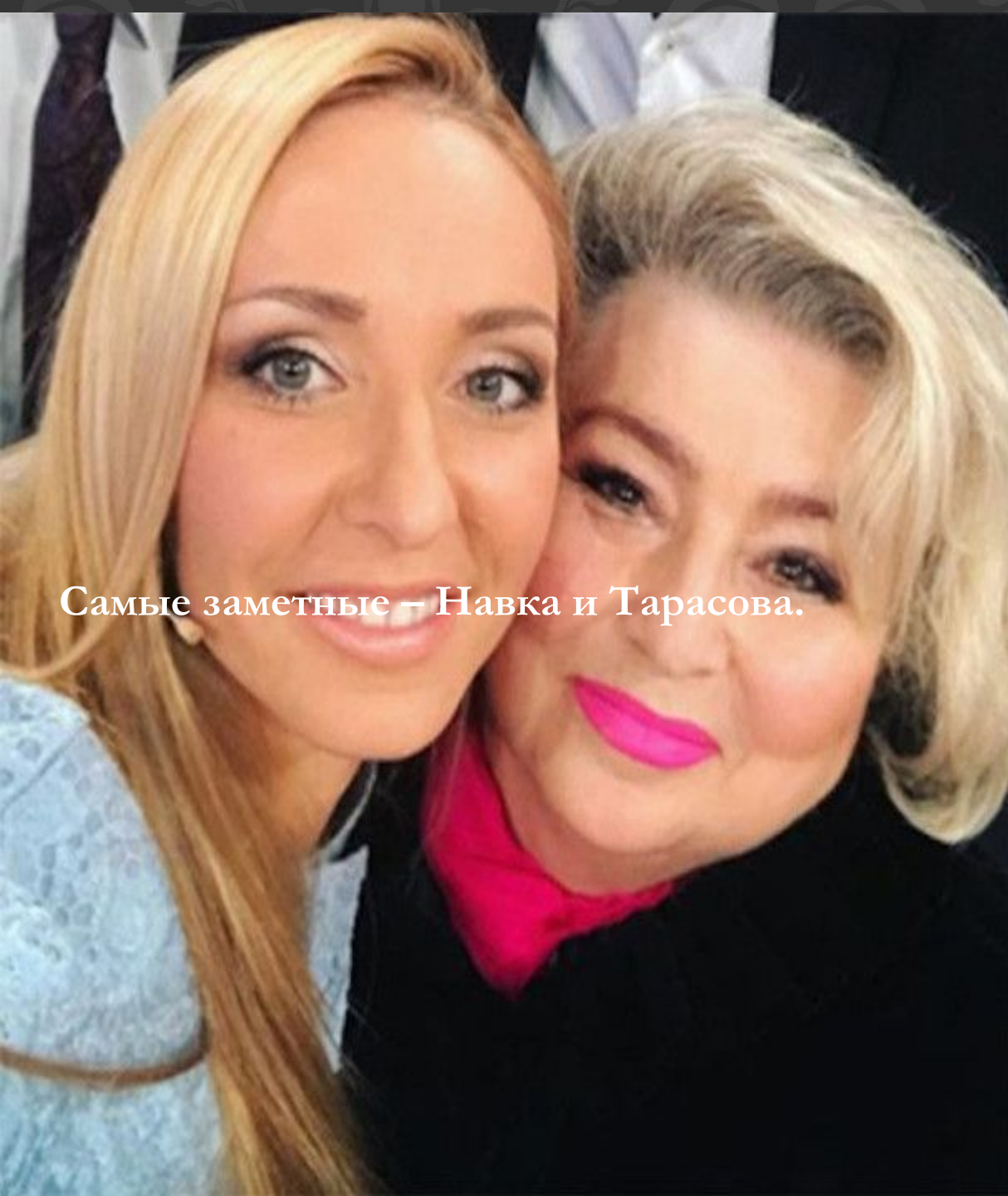
Самые заметные – Навка и Тарасова.

Наверное, все заметили, что самые популярные сегодня телепроекты «Ледниковый период» и «Лёд и пламя» тоже богаты на Татьян. Это не столько экранные, сколько спортивные имена. Огромное количество публикаций в современной прессе посвящено личной жизни и спортивной карьере каждой из этих звёзд фигурного катания.