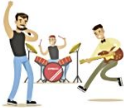
el grupo musical