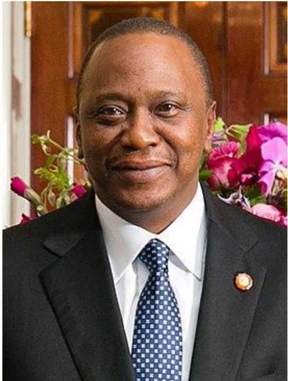
Ухуру Муигаи Кениата