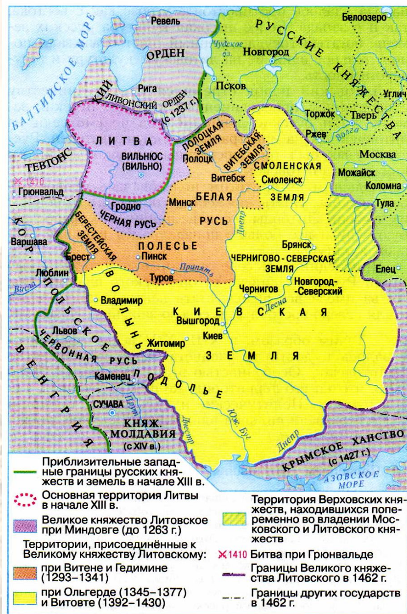
Великое княжество Литовское в XIII—XV веках

Государство Гедимина стало называться Великим княжеством Литовским.