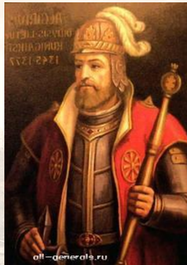
Князь Ольгерд (1345-1377г.г.)