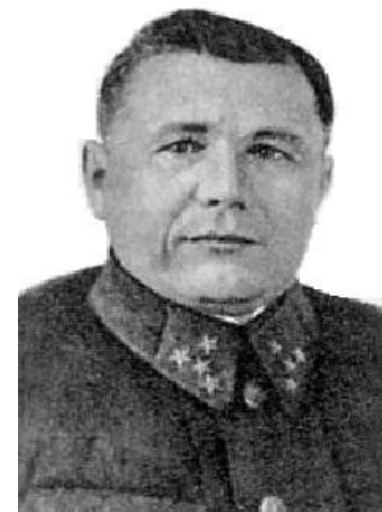
Командующий Брянским фронтом А.И. Еременко