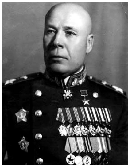
Дважды герой Советского союза Семён Константинович Тимошенко (командующий Западным фронтом)