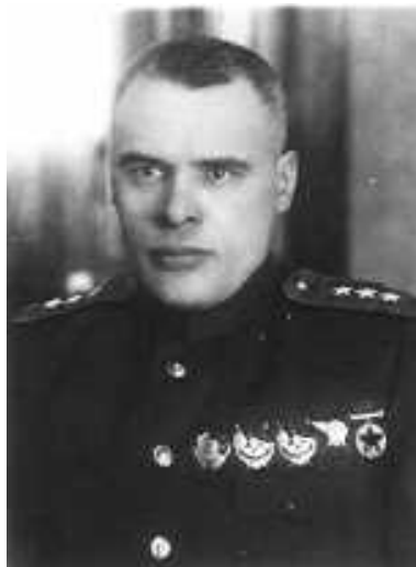
Генерал-полковник Фёдор Исидорович Кузнецов (командующий Центральным фронтом)