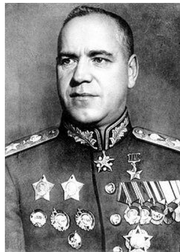
Генерал армии Георгий Константинович Жуков (командующий Резервным фронтом)