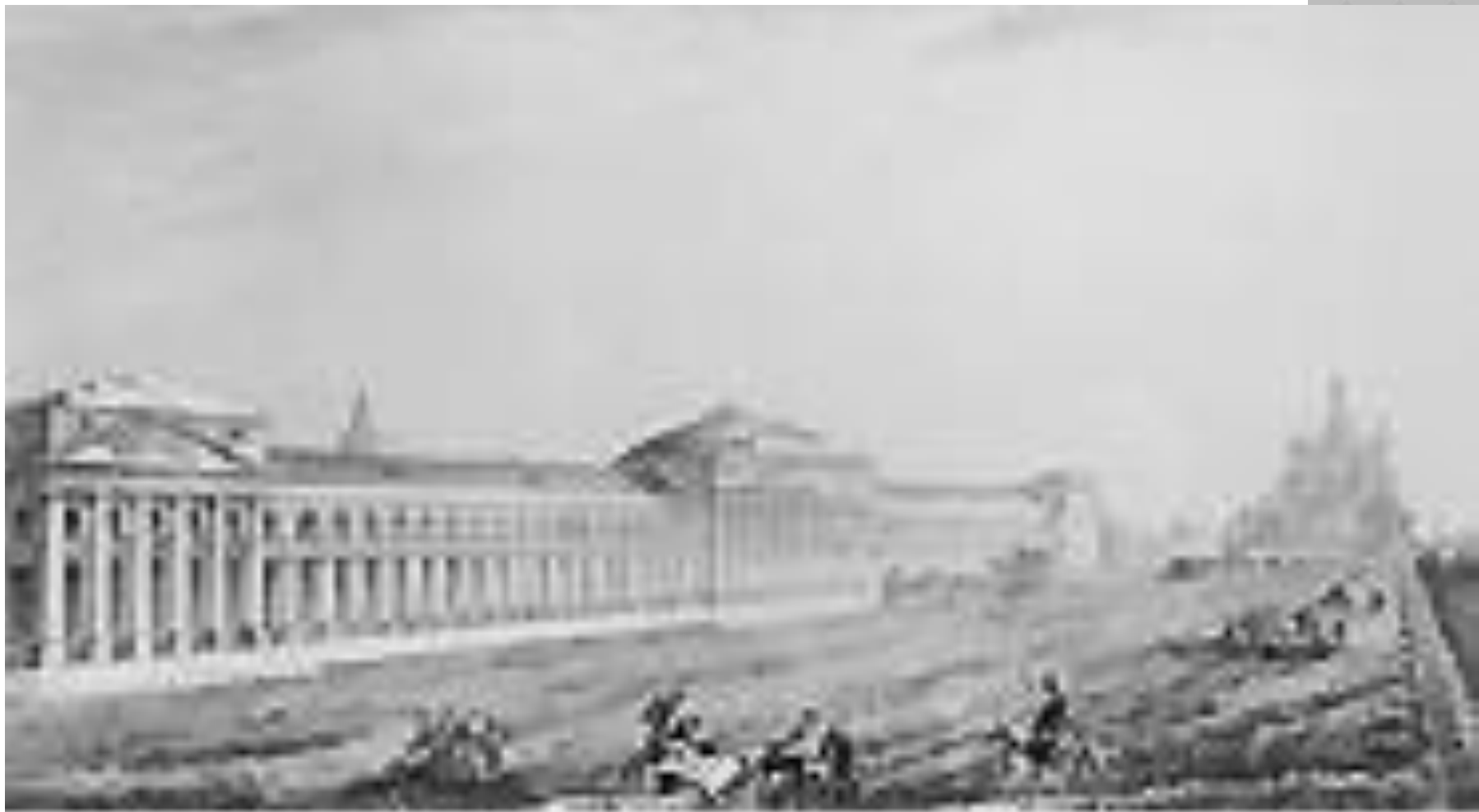
Осип Бове. Красная площадь, реконструированная после пожара 1812 г.