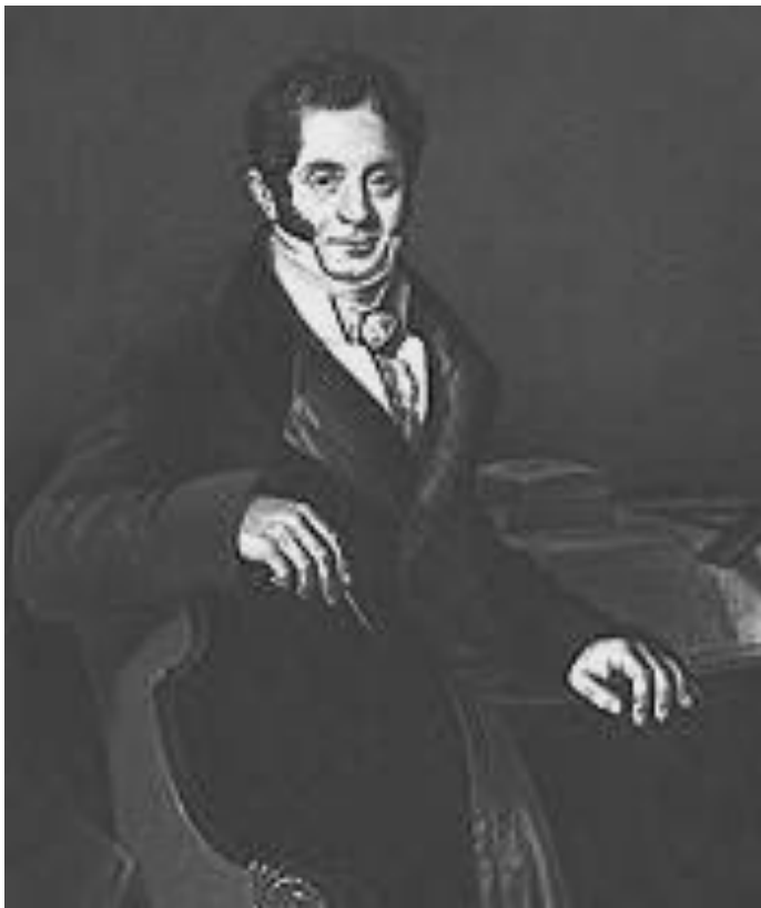
Карл Иванович Росси