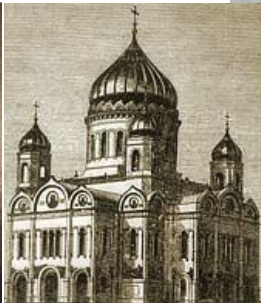
Константин Андреевич Тон Храм Христа Спасителя