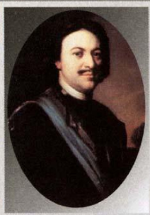
Император Петр I (1672-1725, правил с 1682)