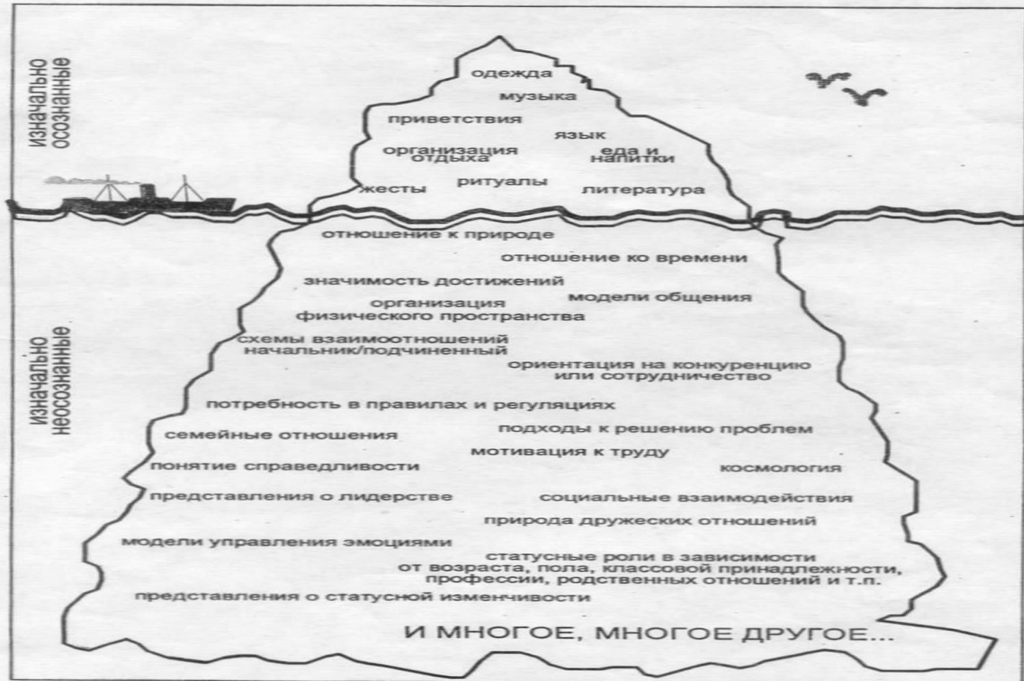
Айсберг как образ национальной культуры