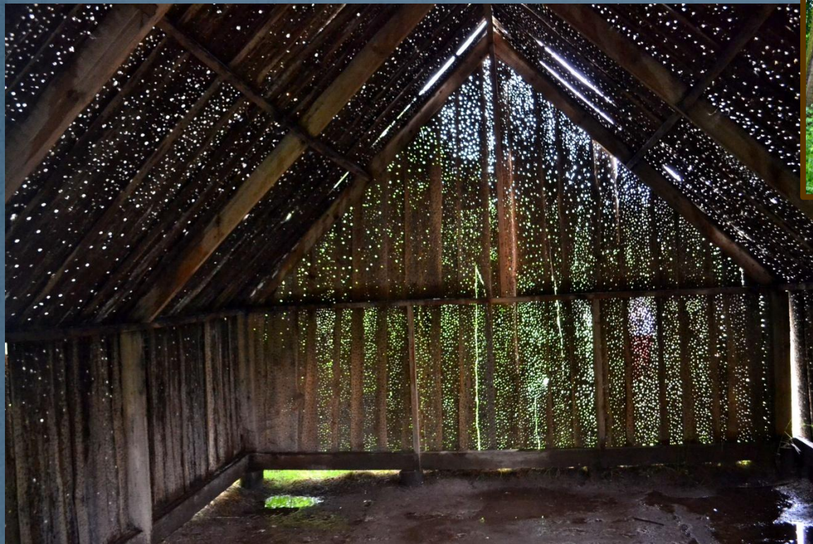
«Сарай». Из отверстий падают, перекрещиваясь Солнечные лучи.

На территории арт-парка находится более 30 объектов. Чтоб их обойти, нужно примерно 4 -5 часов.