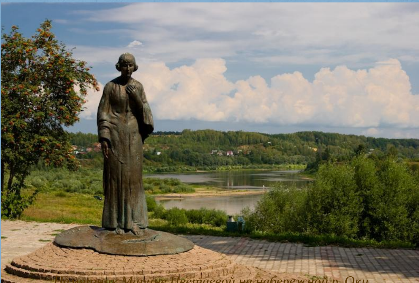
Памятник Марине Цветаевой на набережной р. Оки.