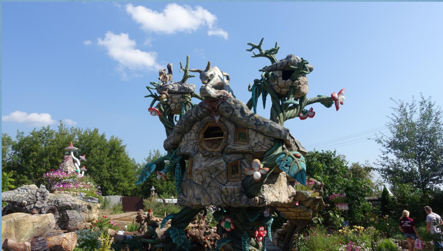
Сказочный дом «Вихляндия»

Экскурсионная фирма "День отдыха". www.do-e.ru . Тел.: 8(4842)40-46-60, 8-930-754-46-60