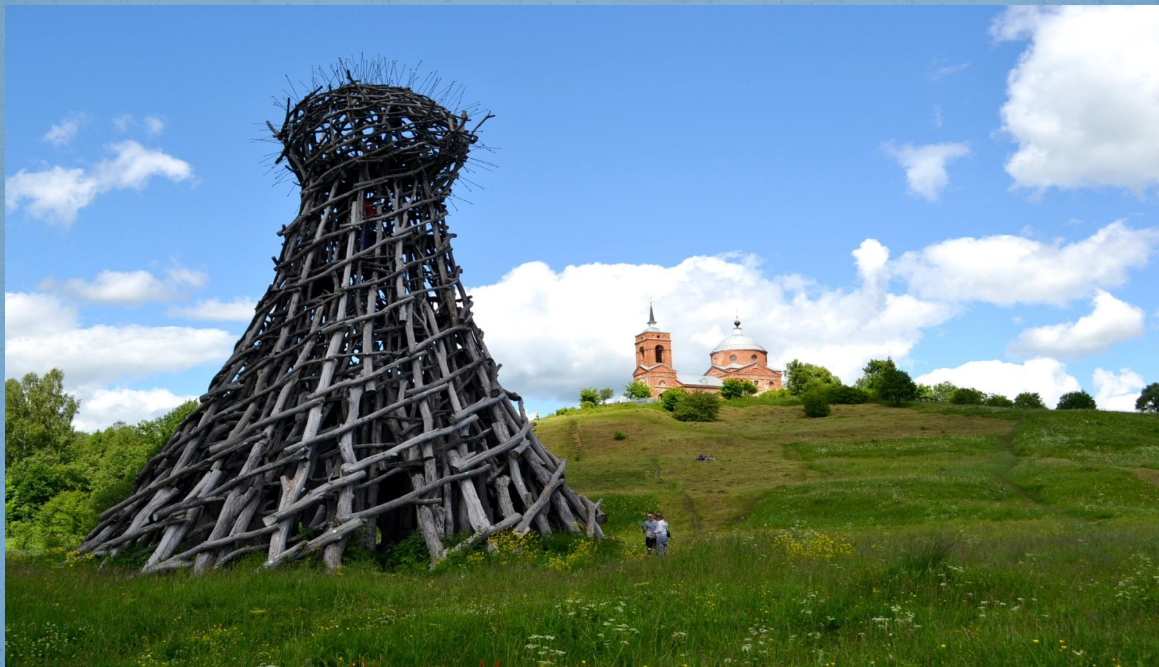
Объект «Маяк» и старая церковь.

Экскурсионная фирма "День отдыха". www.do-e.ru . Тел.: 8(4842)40-46-60, 8-930-754-46-60