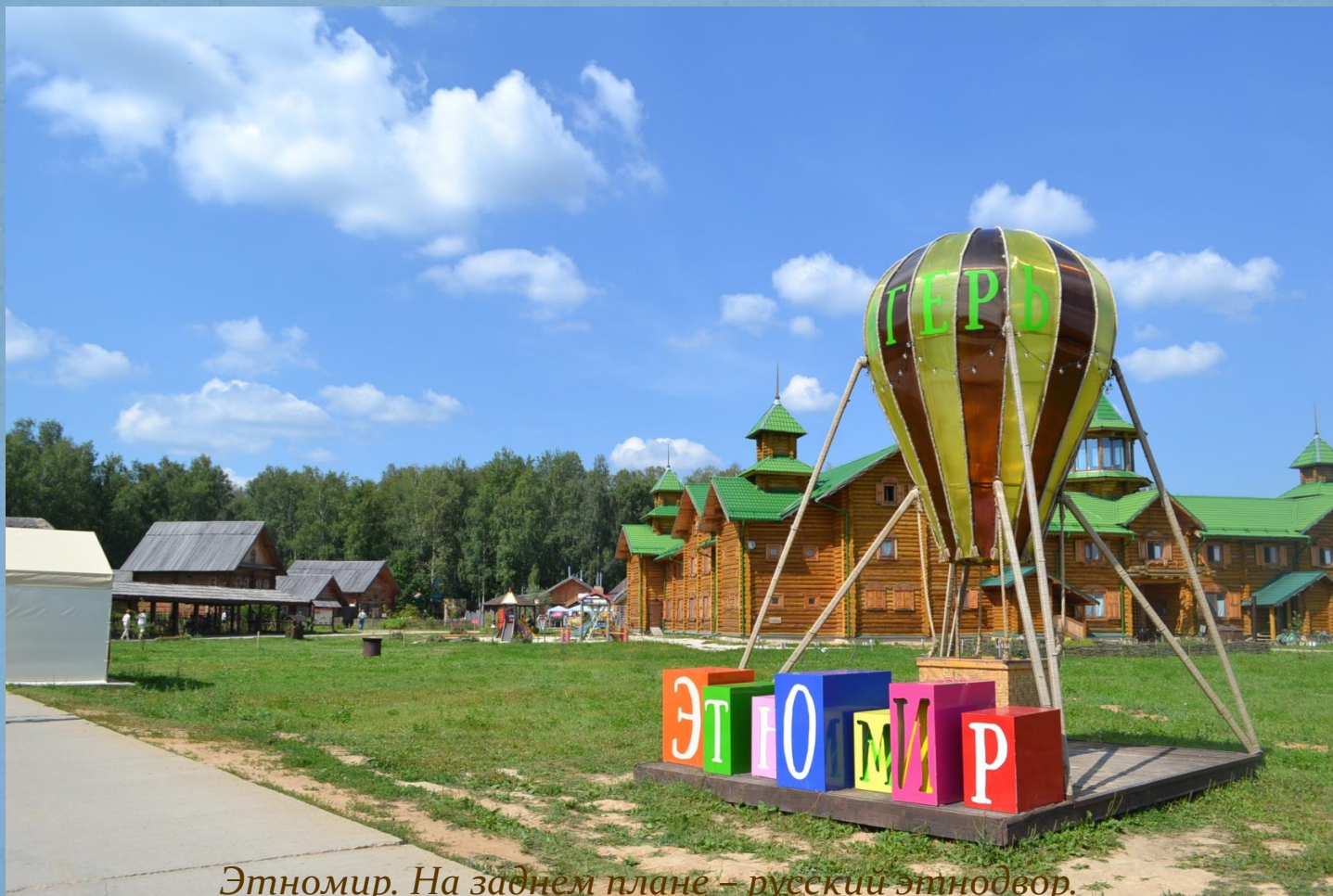
Этномир. На заднем плане – русский этнодвор.