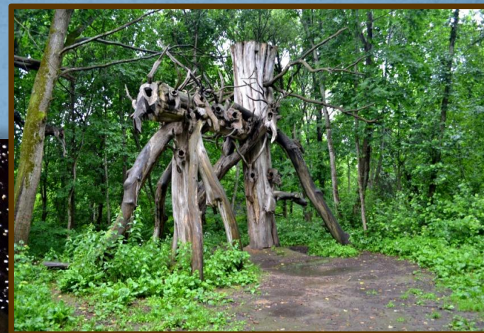
«Городище». Раньше на этом месте жили языческие племена.