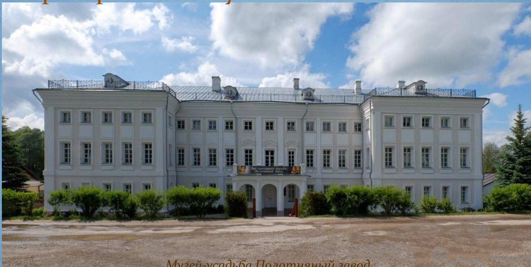
Музей-усадьба Полотняный завод

Экскурсионная фирма "День отдыха". www.do-e.ru . Тел.: 8(4842)40-46-60, 8-930-754-46-60