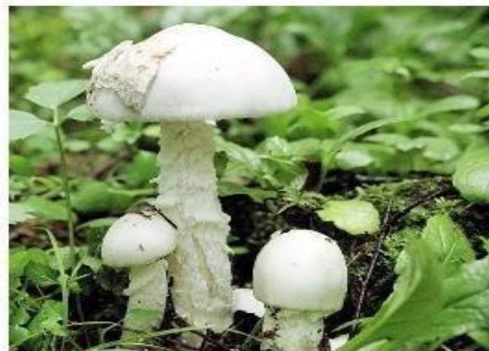
МУХОМОР БЕЛЫЙ ВОНЮЧИЙ