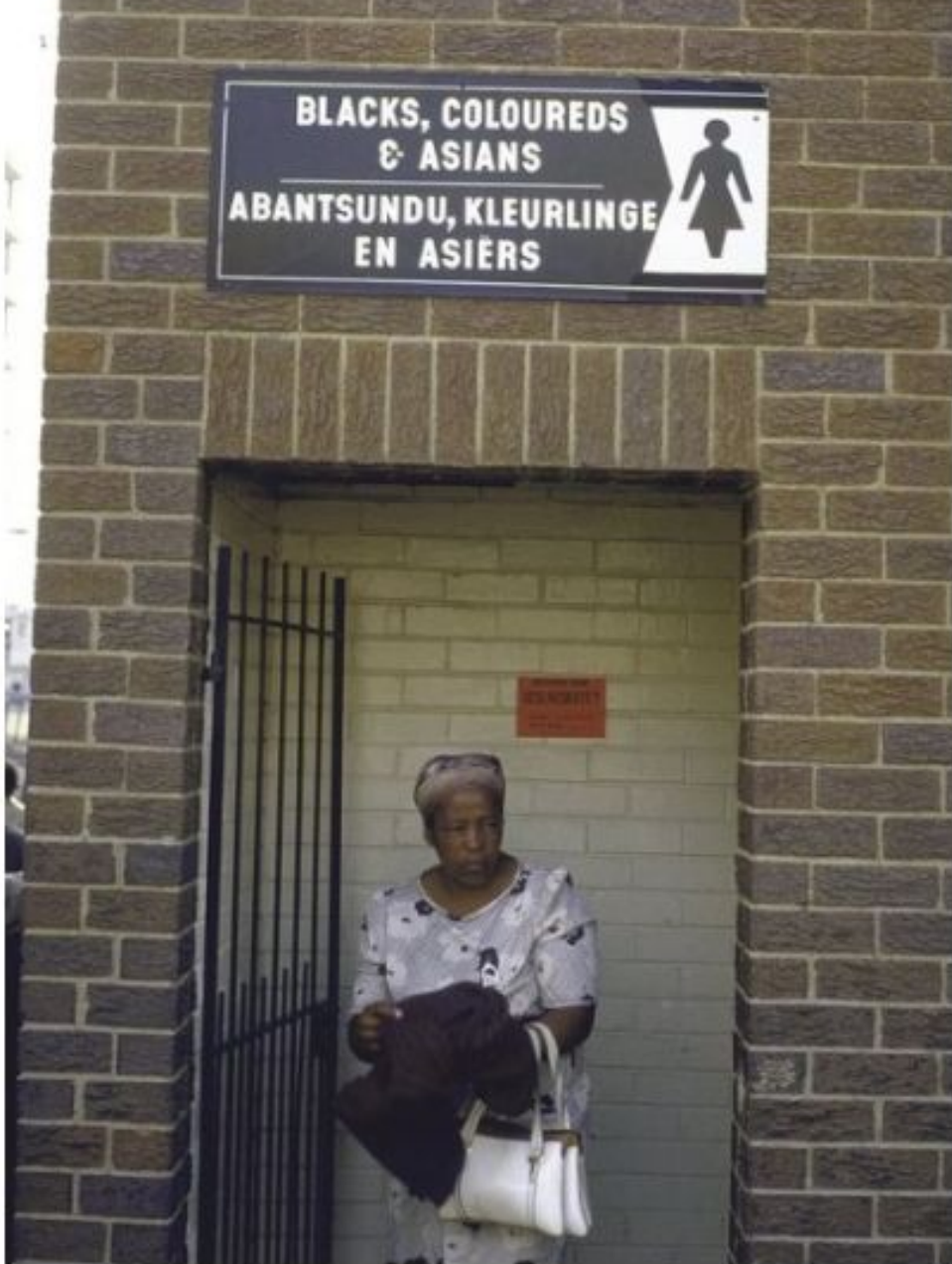
Туалет для черных, цветных и азиатских женщин. 1986 год.