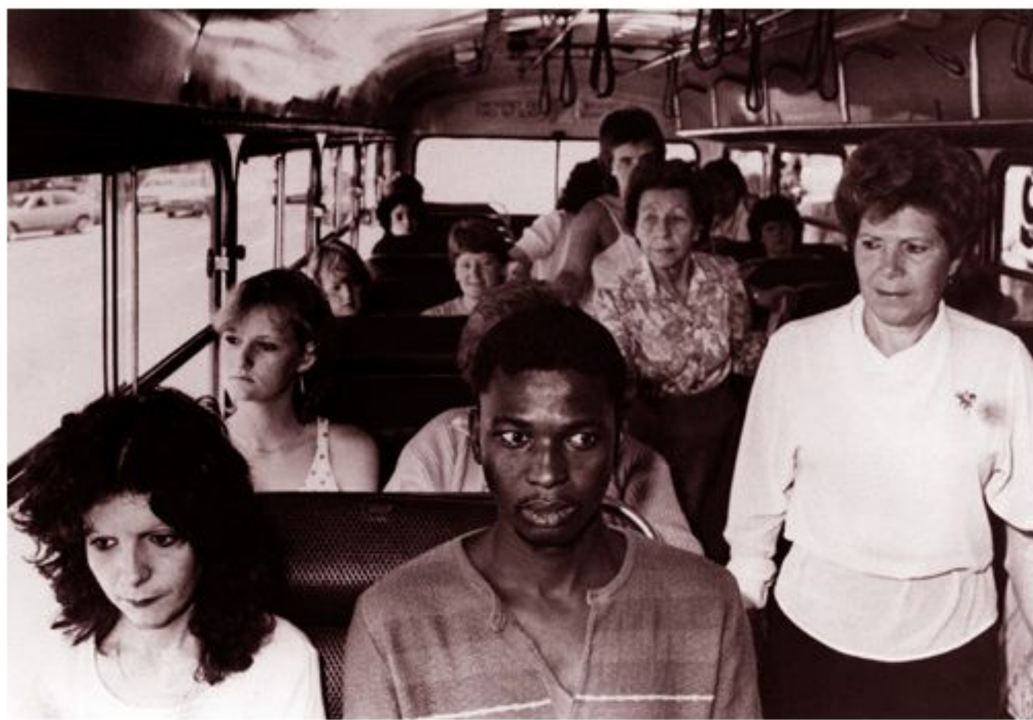
Чернокожий парень в знак протеста заходит в автобус для белых