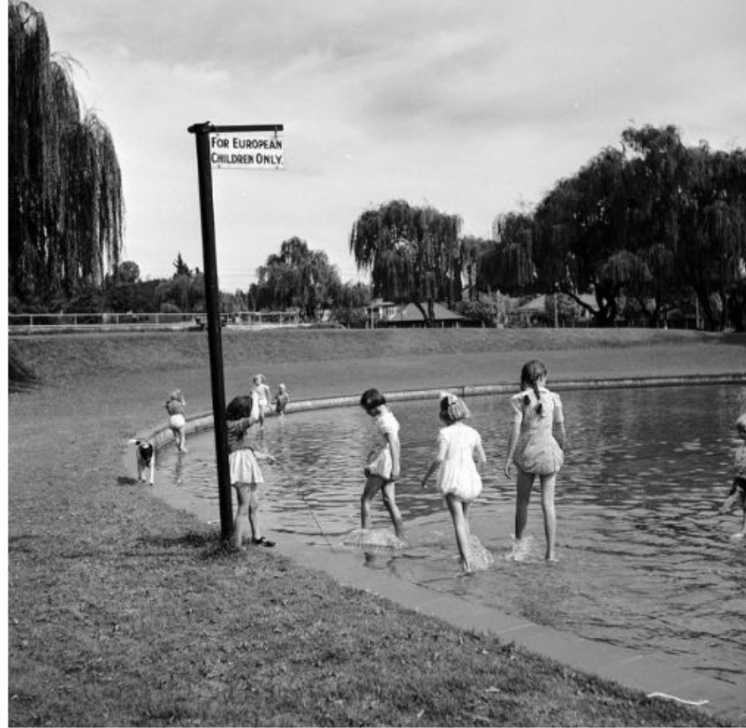
Белые дети в пруду только для белых детей, 1956 год.