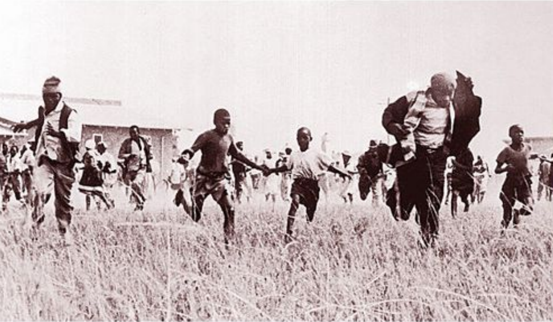
Расстрел в Шарпевилле