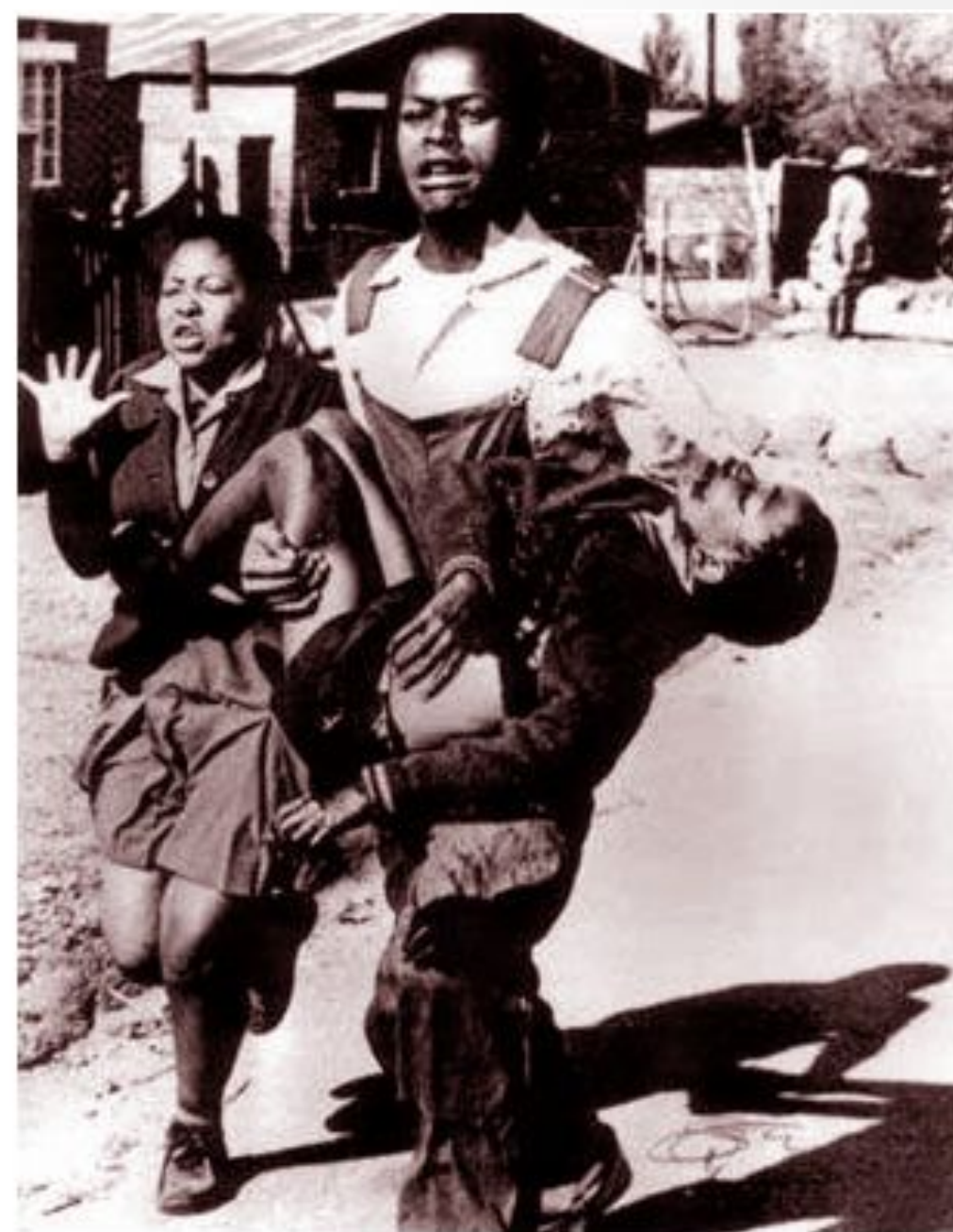
Расстрел демонстрации в Соуэто