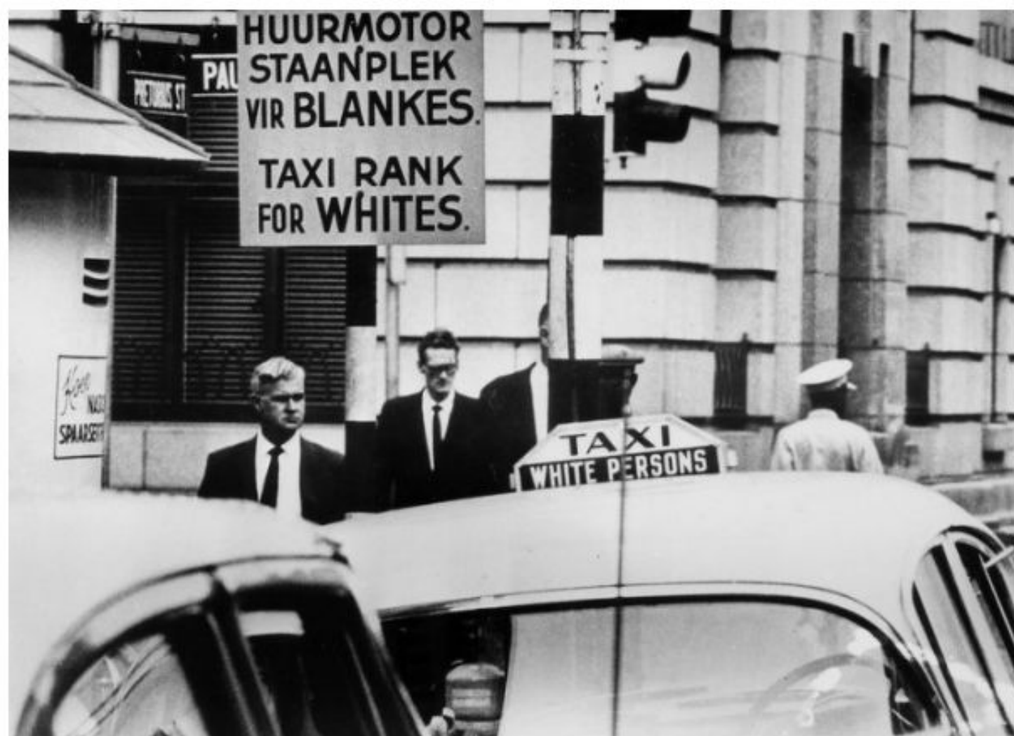
Стоянка такси для белых людей. 1967 год.