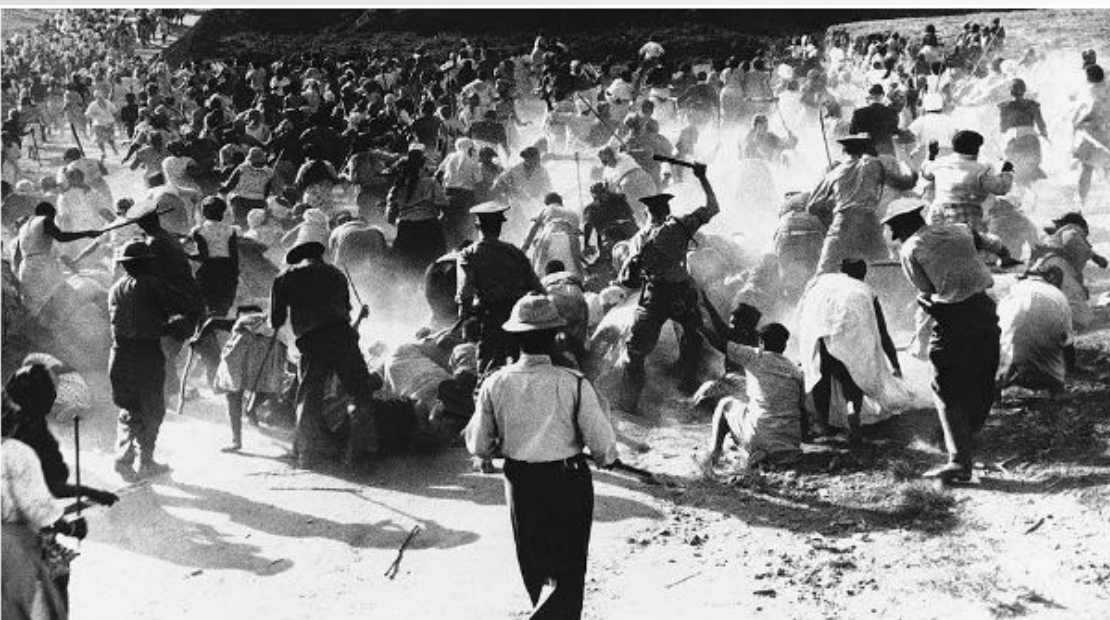
Полиция избивает темнокожих демонстрантов.