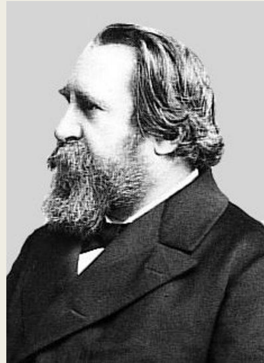
Теодор Герман Мейнерт

В начале XX века в развитии общей психопатологии происходит крен в сторону психологии, исследованиями мозга психопатологи перестают интересоваться. Следующий, уже современный этап в развитии общей психопатологии связан с учением И.П. Павлова.