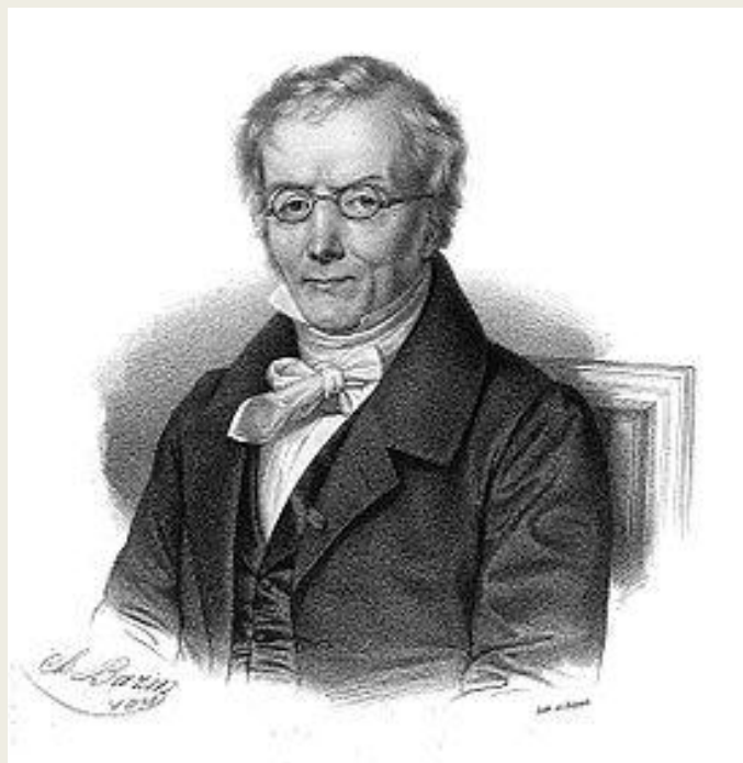
Жан-Этьен Доминик Эскироль