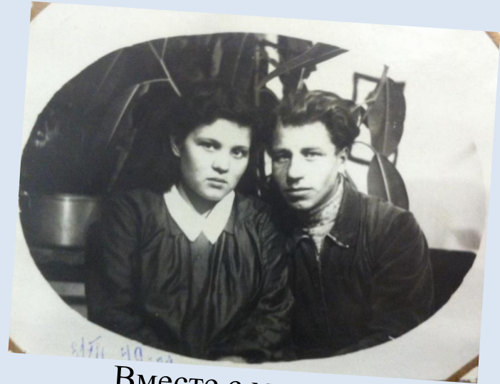
Вместе с мужем