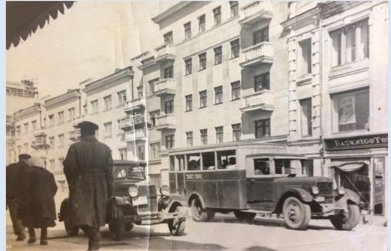
Уфа в годы войны