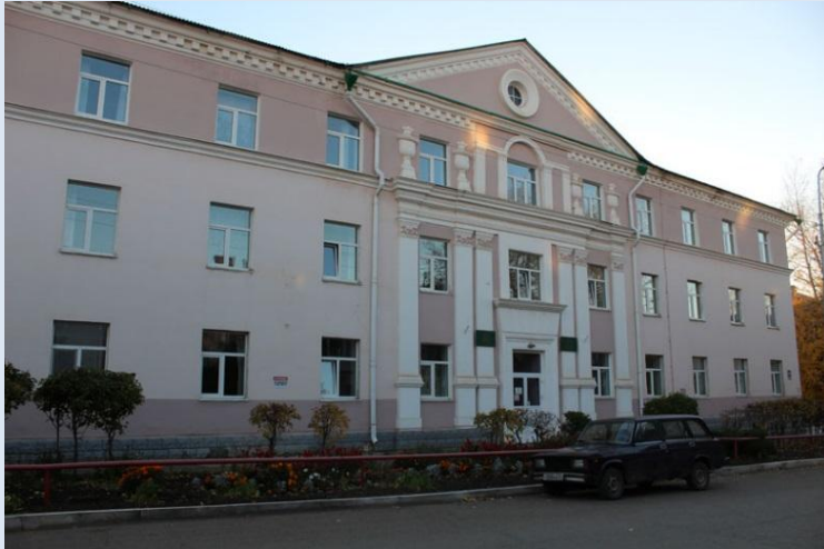
Октябрьский геологоразведочный техникум