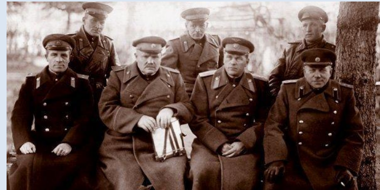
Руководители и ведущие преподаватели Военно-авиационного училища разведчиков Военно-воздушных сил Красной Армии. Давлеканово, 1943 г.