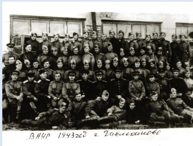
ВАУР 1943г. г. Давлеканово