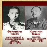
Фумимаро Кондо Премьер-министр и государственный деятель (1881 - 1945)