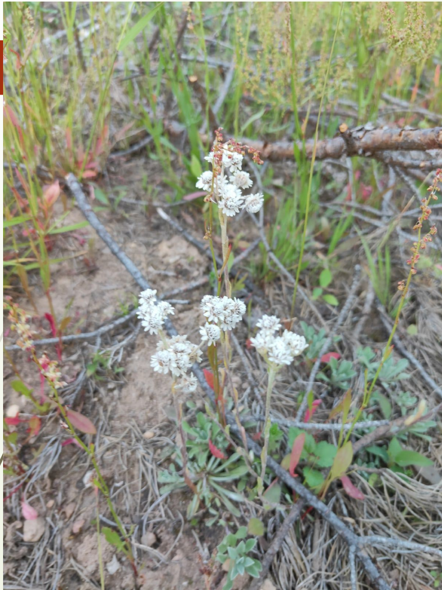
Кошачья лапка двудомная