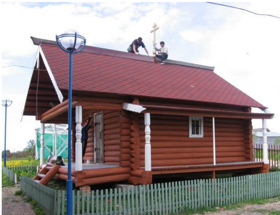
Часовня Св. Вонифатия