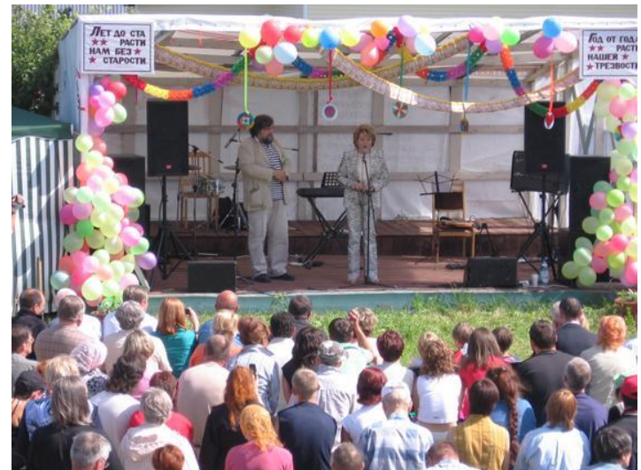
Валентина Матвиенко и Дмитрий Шагин

В июне 2007 года празднование 10-летнего юбилея центра посетила Губернатор Санкт-Петербурга Валентина Ивановна Матвиенко.