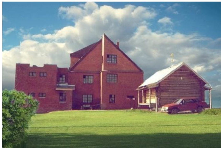
Корпус Вирджинии Бентл