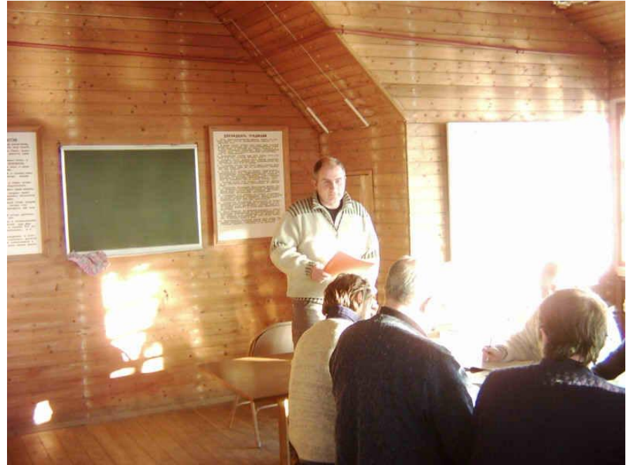
Реабилитационная программа. Занятия в группе