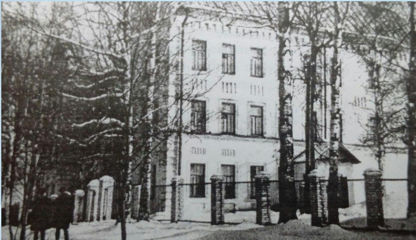
Тихвинская городская больница на ул. Красноармейская