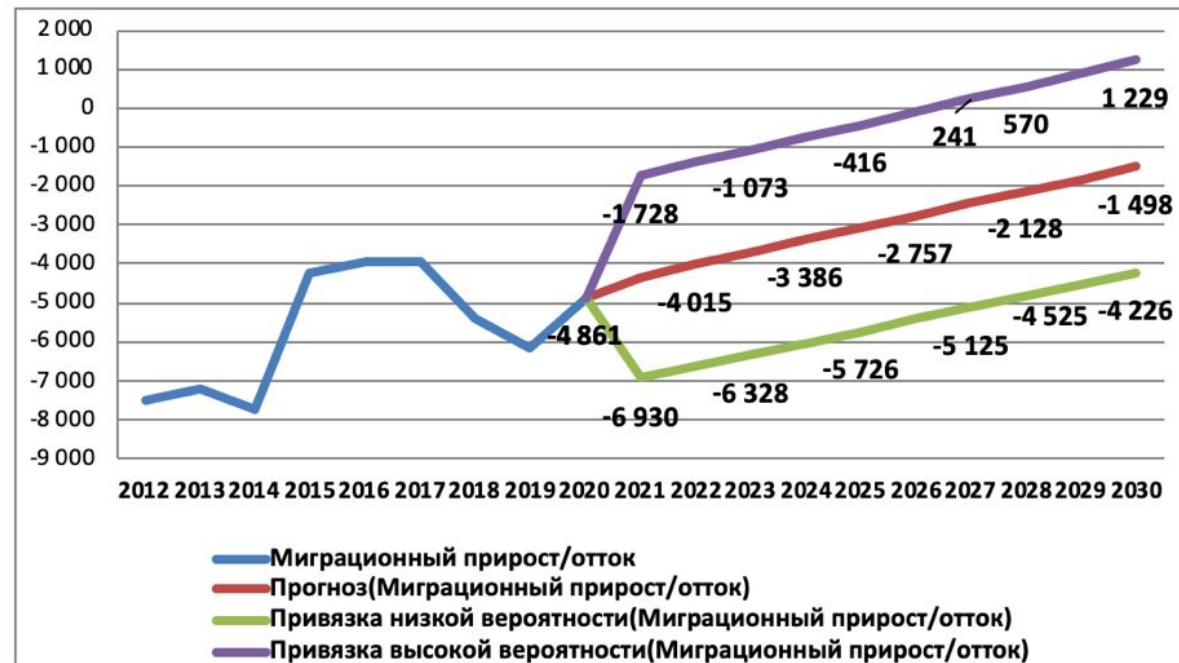
Рис. 3.3. Прогноз миграционного прироста/оттока из Кыргызстана на период до 2030 года

Ряд общих основных иммиграционных проблем: