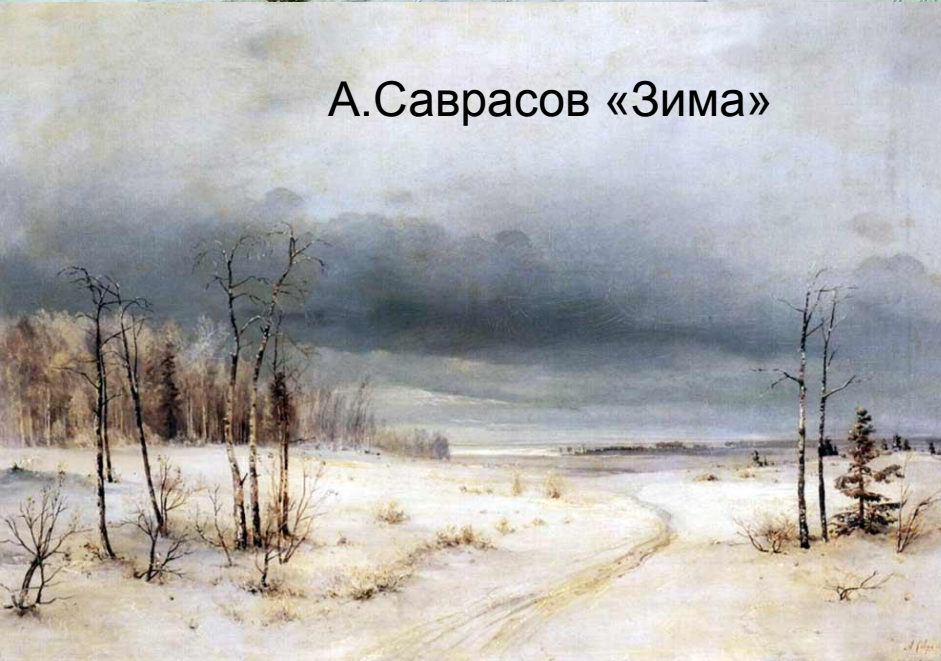
А. Саврасов «Зима»