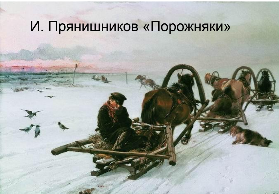
И. Прянишников «Порожняки»