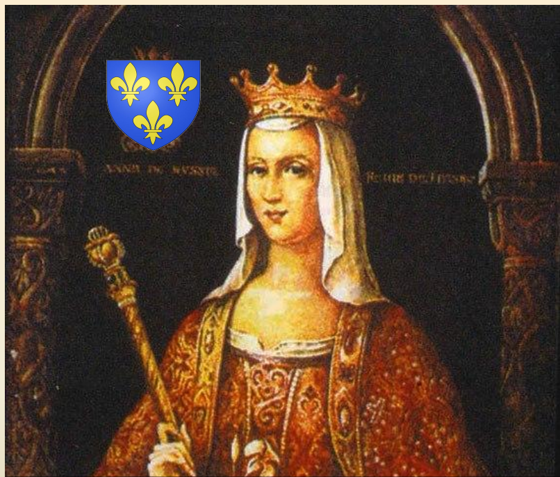
Анна Ярославна (дочь Ярослава, королева Франции)