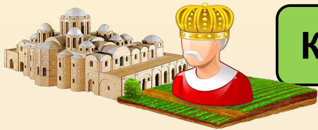
Схема управления государством при Ярославе Мудром