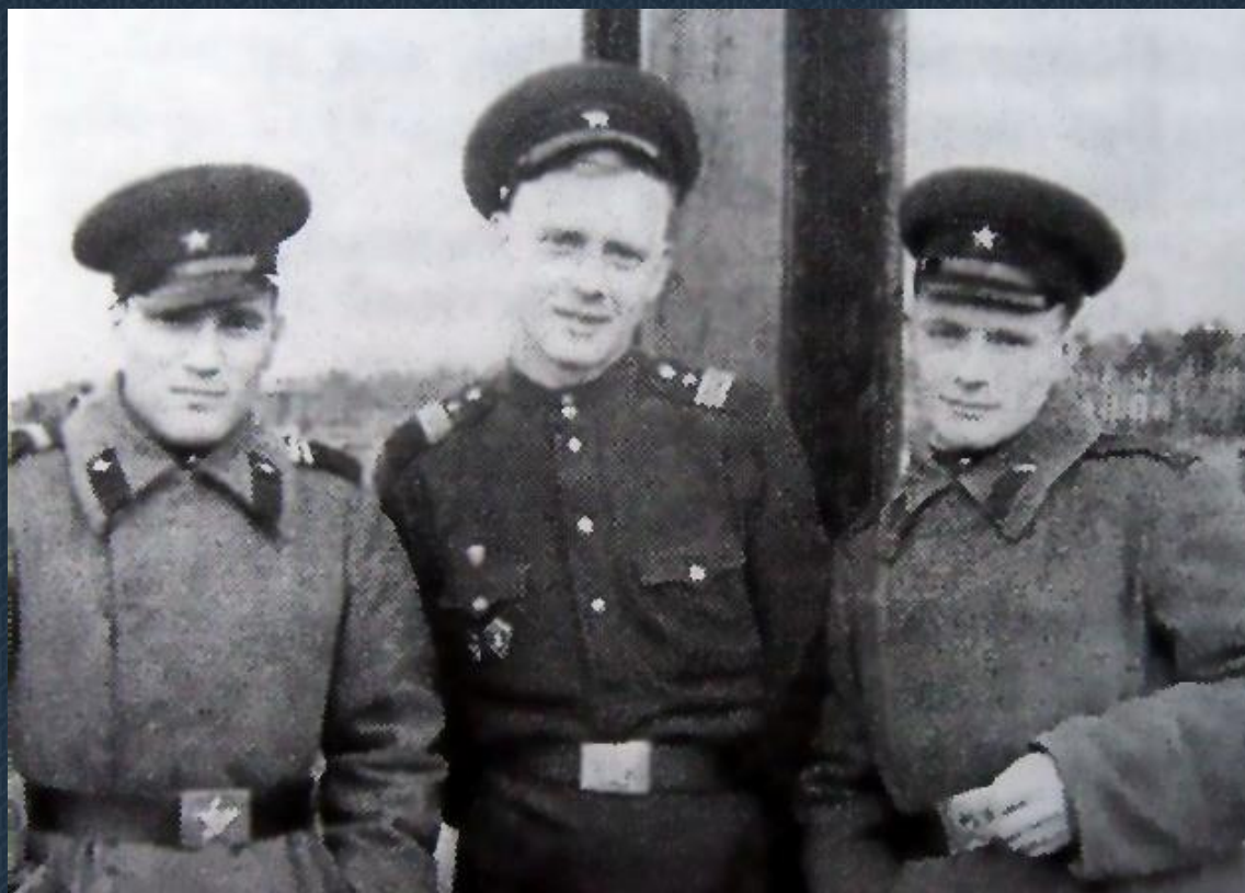
Юрий Визбор по середине

Первыми песнями, в которых Визбор выступил как поэт и композитор, стали «Синие горы», «Маленький радист», «Романтики», «Домбайский вальс».