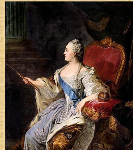
Екатерина II- мать Павла I