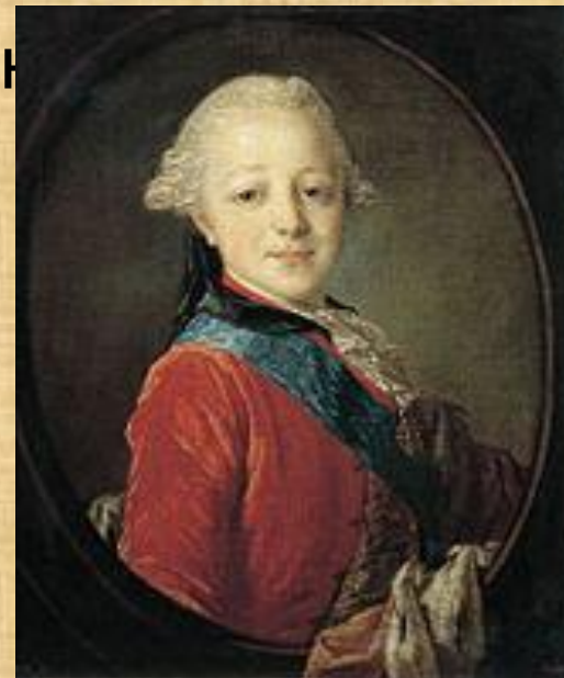
Павел I в 7 лет

Павел I изучал историю, математику, иностранные языки, географию.