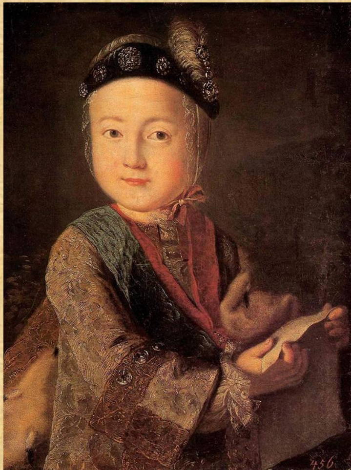
Павел I в детстве