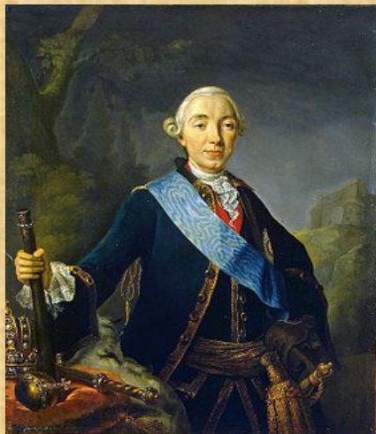
Петр III – отец Павла I

Павел I- сын Петра III и Екатерины II. Родился 20 сентября (1 октября) 1754 г.