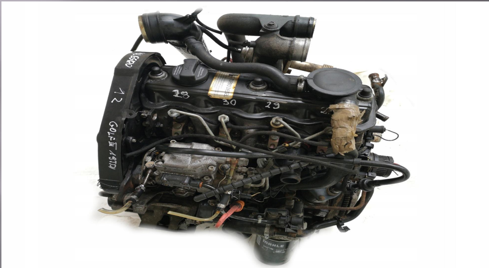
ДВИГАТЕЛЬ ДИЗЕЛЬ TDI