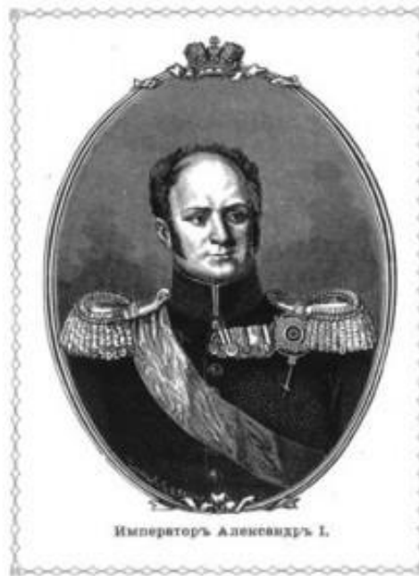
Императоръ Александръ I.

О быкновенное подавiе нищихъ, умножая только число оныхъ, не упокоютъ старца, отягощеннаго лѣтами, не возвратитъ здоровья юношѣ, увядающему на зарѣ дней своихъ, не избавитъ отъ смерти или порока младенца, долженствующаго быть подпорою отечества. Не рѣдко также наглый туземецъ похищаетъ отъ руки благотѣльной то, что назначено было отцу сенебства, томившемуся на одрѣ смерти и отчаянiя. Изъ сего слѣдуетъ, что растроганннхъ быть иужоннхъ и весьма часто обманчивымъ видомъ нищеты и убожества, не есть еще благодѣянiе. Надлежитъ искать несчастныхъ въ самомъ жилищѣ ихъ—въ сей обители плача и страданiя. Ласковымъ обращенiемъ, спасительными совѣтами, словомъ всѣми нравственными и физическими способами стараться облегчить