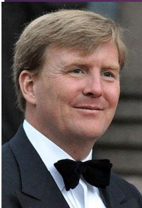
Виллем-Александр 7-й Король Нидерландов

“Социального государства 20 века больше не существует”.