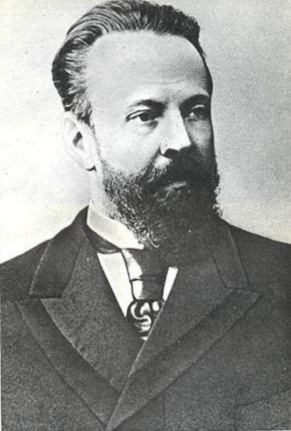
Сергей Юльевич Витте. Министр финансов.