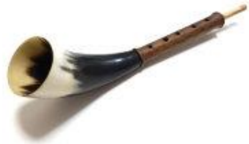
Тверской Рожок ( Жалейка )