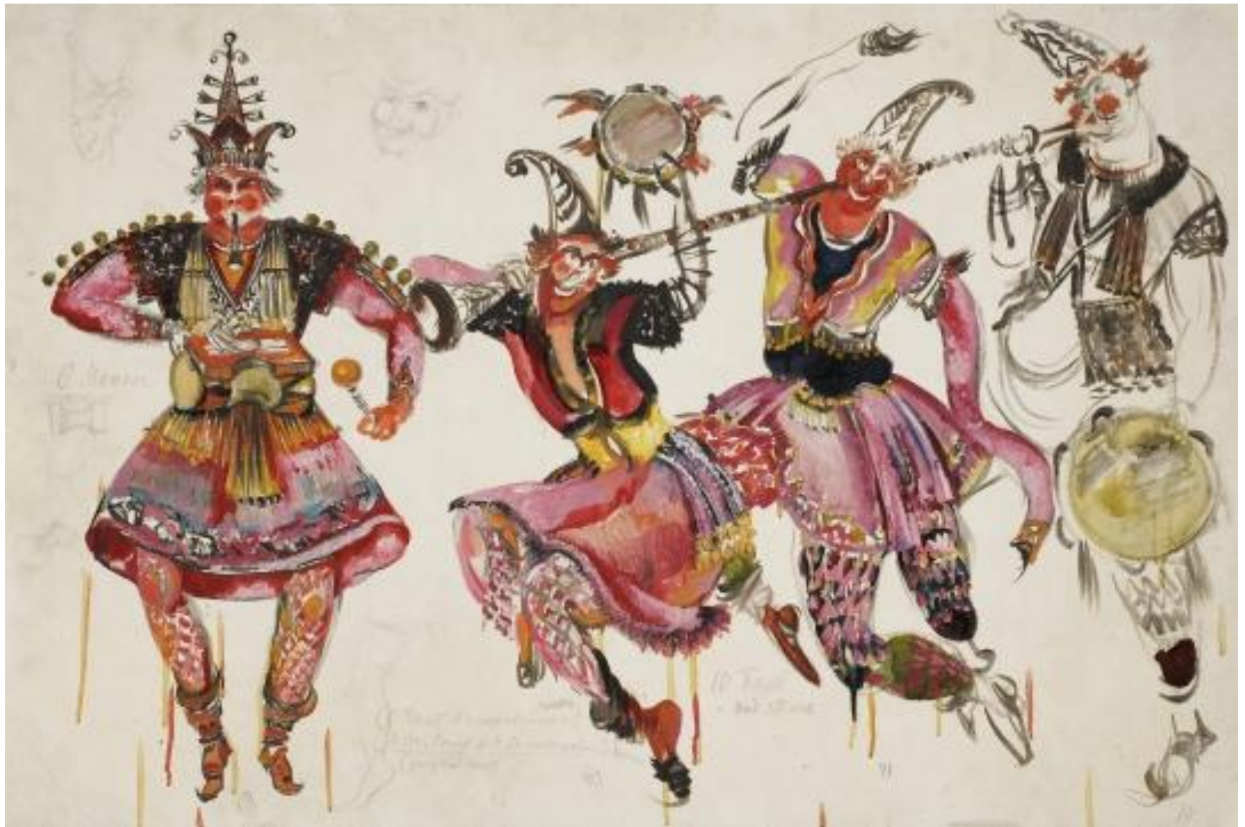
"Скоморохи". Эскиз мужских костюмов к спектаклю. 1935. «Садко» опера Н.А. Римского-Корсакова