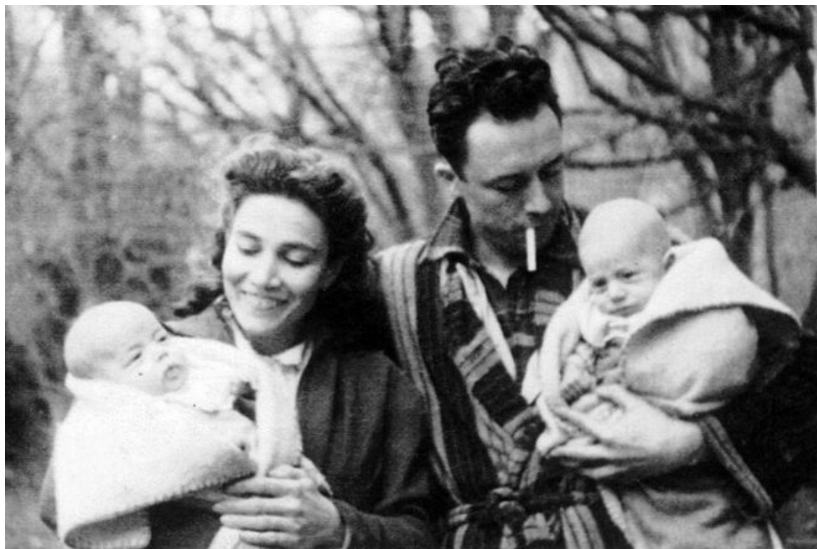
Альбер Камю и Франсина Форе с детьми