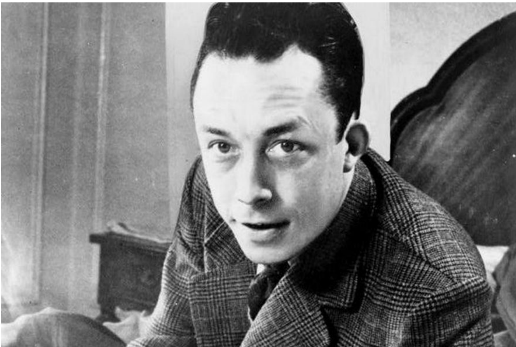
Альбер Камю в молодости