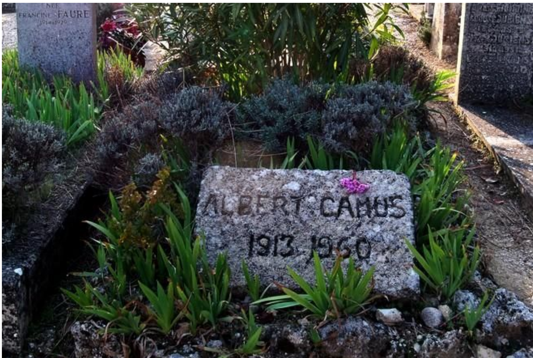
Могила Альбера Камю