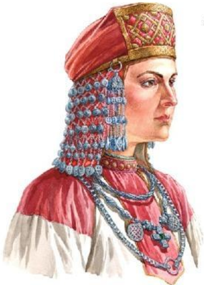
Славянская женщина в уборе с колоховидными подвесками и сетью-подняв (в. п. XII в.)