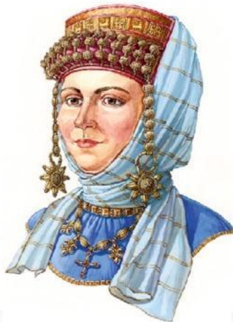
Русская женщина в уборе с золотами на рясках и очельем, вторая половина XII века.