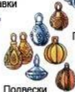
Подвески к одежде