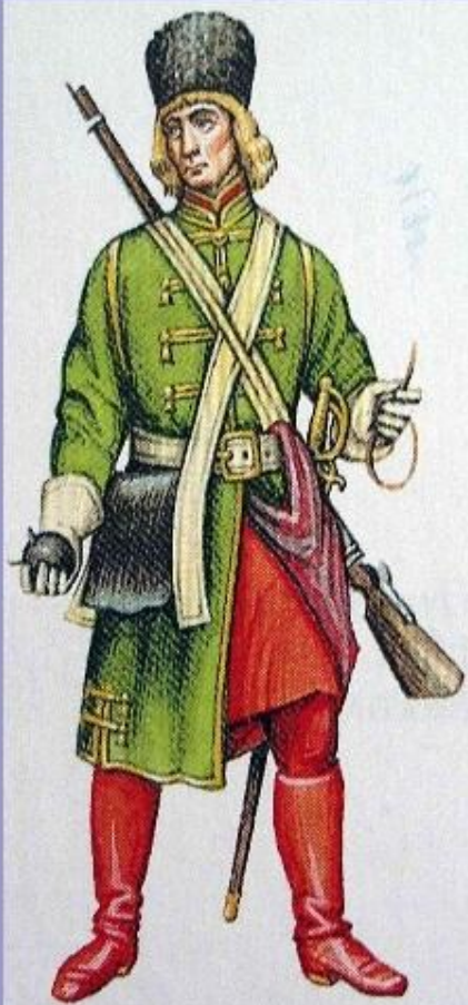
Солдат Семеновского полка. Кон. 17 в.