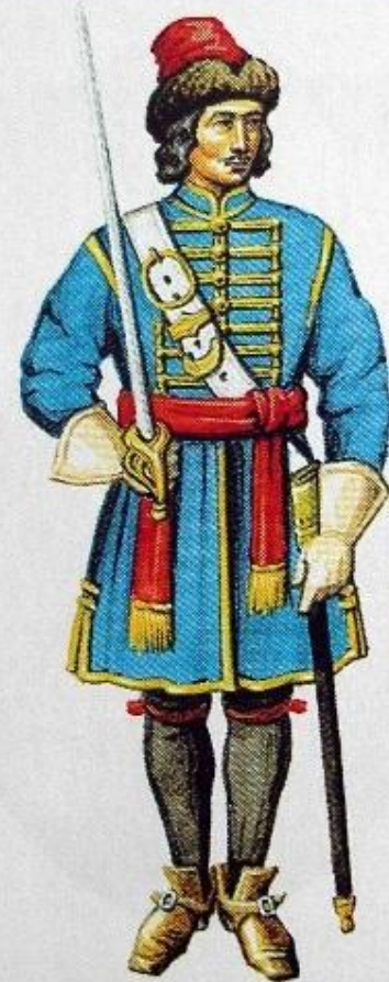
Гренадер Преображенского полка. Кон. 17 в.

С двух «потешных» полков Семеновского и Преображенского начиналось создание новой русской армии