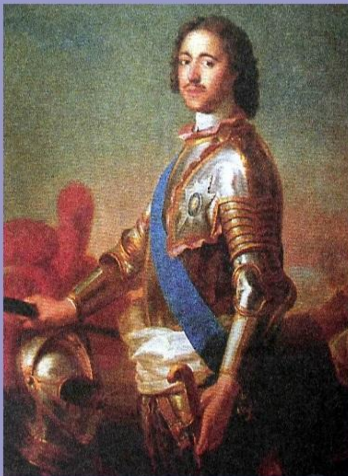
Петр I. Художник Ж. Наттье