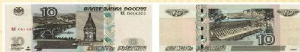
Билет Банка России образца 1997 года номиналом 10 рублей модификации 2004 г.

Эти купюры начинал коллекционировать мой дедушка, теперь наступила и моя очередь дополнять эту коллекцию. Казалось бы, зачем хранить у себя дома деньги, которые давно вышли из оборота. За них же все равно ничего не купишь. Однако не стоит торопиться и выкидывать их. Ведь это часть истории нашего государства, которая ушла в прошлое.