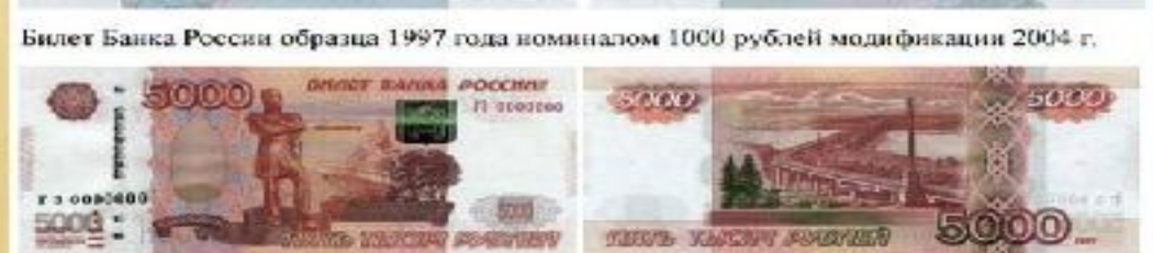
Билет Банка России образца 1997 года номиналом 5000 рублей модификации 2010 г.