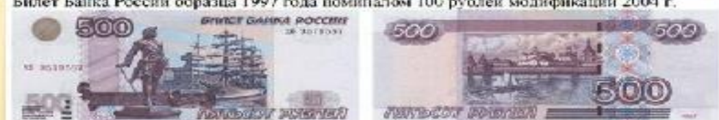
Билет Банка России образца 1997 года номиналом 500 рублей модификации 2004 г.