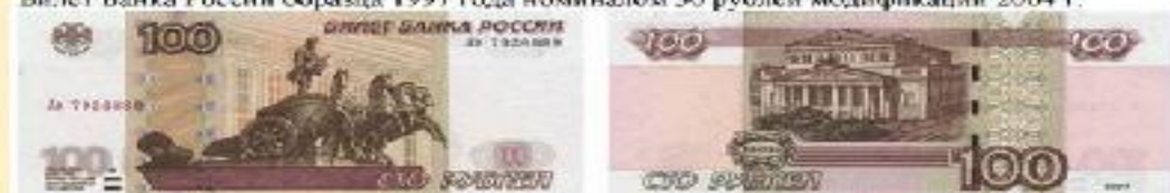
Билет Банка России образца 1997 года номиналом 100 рублей модификации 2004 г.