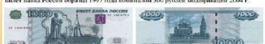
Билет Банка России образца 1997 года номиналом 1000 рублей модификации 2004 г.