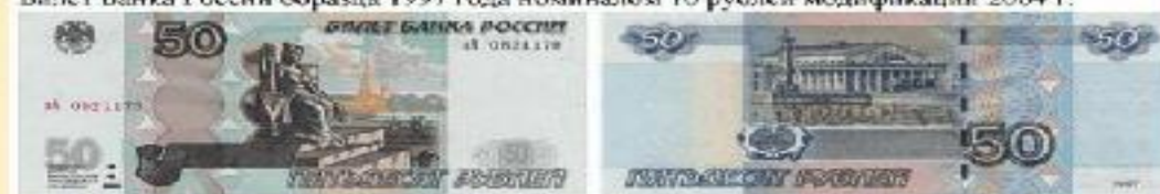
Билет Банка России образца 1997 года номиналом 50 рублей модификации 2004 г.