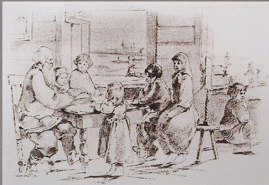
Русские пословицы и поговорки. 1866—1867 гг.