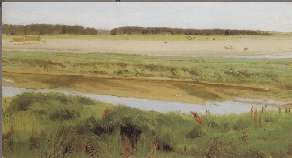
Река Вятка. 1878 г.

В 1858 году Васнецов поступил в духовное училище, затем — в семинарию. Он изучал жития святых, хронографы, летописные своды, притчи. Древнерусская литература зародила в художнике интерес к старине.