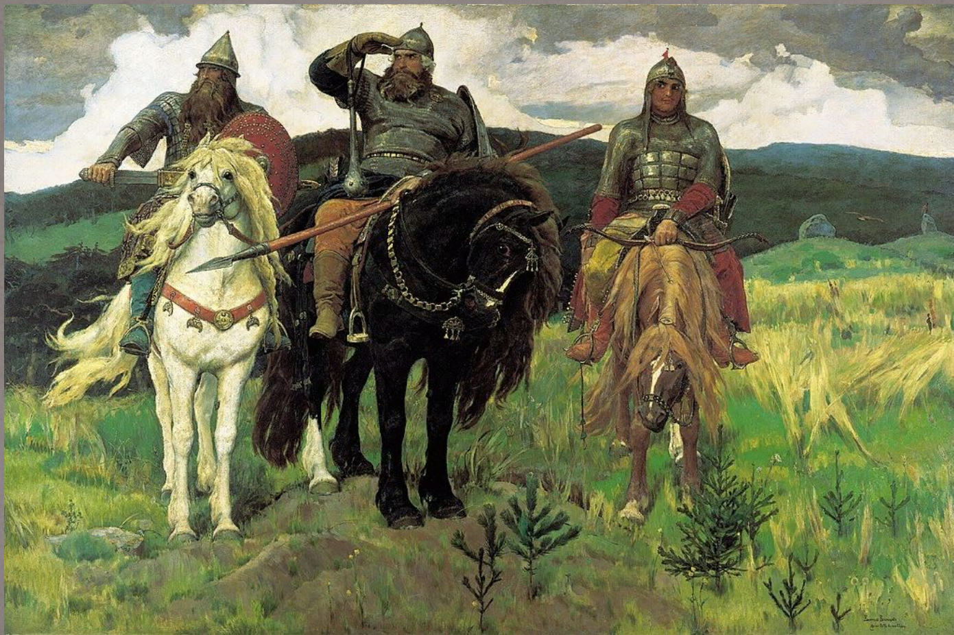
Богатыри. 1881—1898 гг.

После окончания академии художник уехал с друзьями за границу. Там продолжил писать, участвовал в выставках и салонах. В парижской мастерской своего друга Василия Поленова Васнецов набросал эскиз картины «Богатыри» — первого полотна по мотивам русских былин .