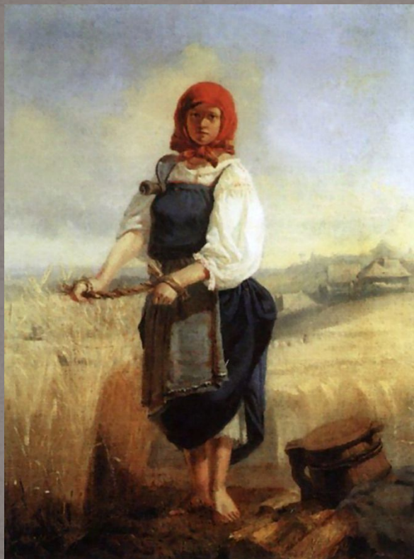
Жница. 1867 г.

В свободное от учёбы время Васнецов рисовал портреты горожан, делал по памяти зарисовки, помогал расписывать Вятский кафедральный собор. В 1867 году он проиллюстрировал книгу этнографа Николая Трапицина о пословицах. Позже художник опубликовал свои рисунки отдельно — в альбоме «Русские пословицы и поговорки в рисунках В.М. Васнецова». В годы учебы живописец создал первые полотна «Жница» и «Молочница».