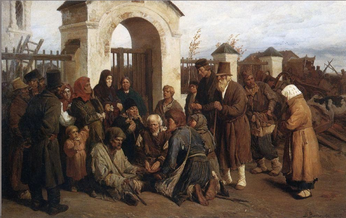
Нищие-певцы (Богомольцы). 1873 г.