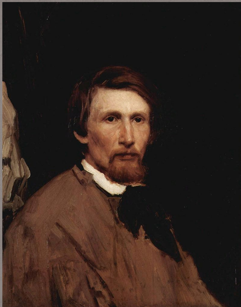
Автопортрет. 1873 г.

Виктор Васнецов умер в своей мастерской в 1926 году. Художника похоронили на Введенском кладбище в Лефортово.