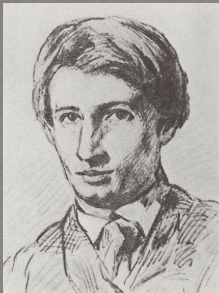
Автопортрет. 1868 г.

художнике интерес к старине. Виктор Васнецов родился 15 мая 1848 года в Вятской губернии (сегодня — Кировская область) в семье священника. Родители старались дать детям разностороннее образование: читали им научные журналы, учили рисованию. Первыми работами Виктора Васнецова были пейзажи, сюжеты сельской жизни. Природа на его картинах во многом списана с вятских видов: извилистые реки, холмы, густые хвойные леса.