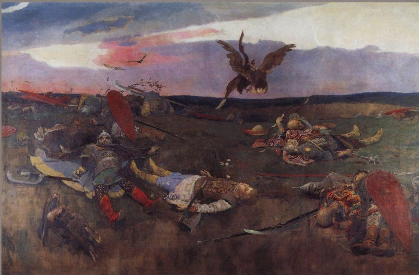
После побоища Игоря Святославовича с половцами. 1880—1890-е гг.

В московский период художник писал картины с сюжетами из истории и сказок Древней Руси. Одно из первых полотен — «После побоища Игоря Святославича с половцами» — экспонировалось на VIII выставке передвижников. Картину купил Павел Третьяков.