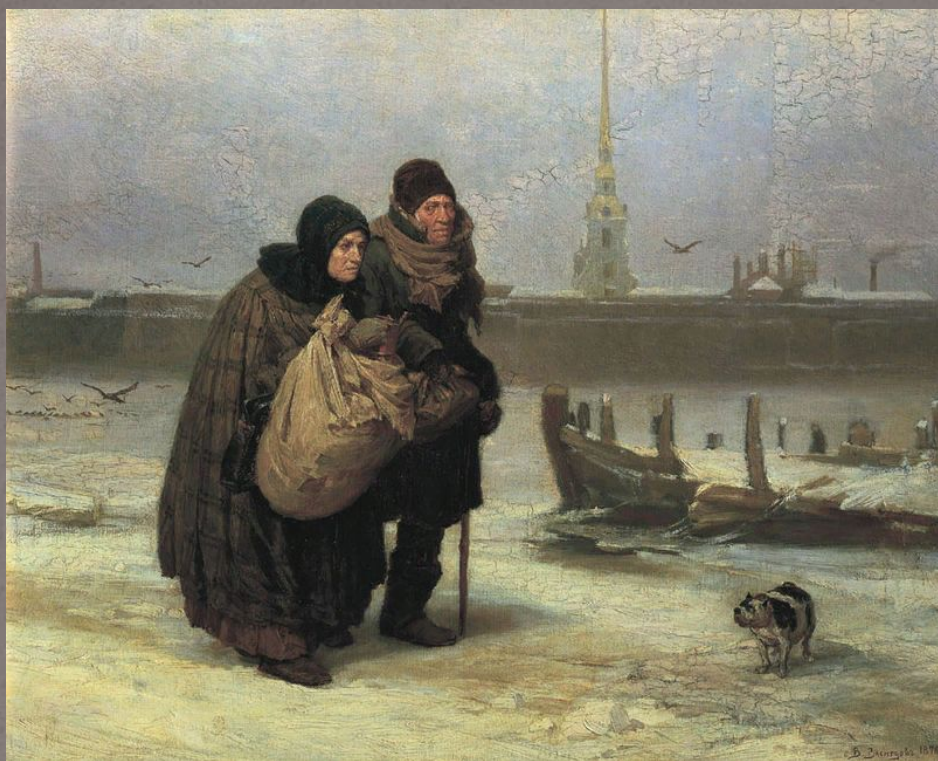
С квартиры на квартиру. 1876 г.