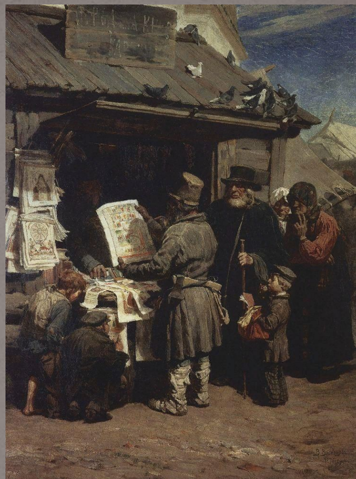
Книжная лавочка. 1876 г.