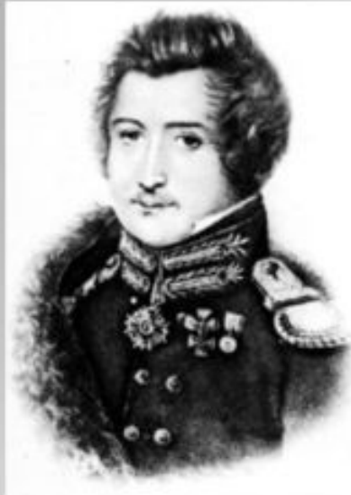
С. И. Муравьев- Апостол