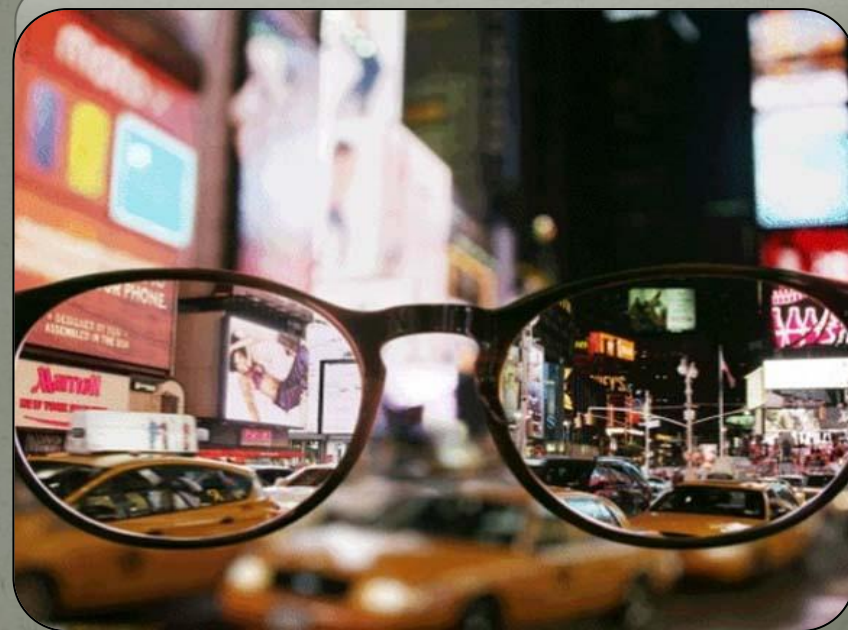
Зрение при близорукости