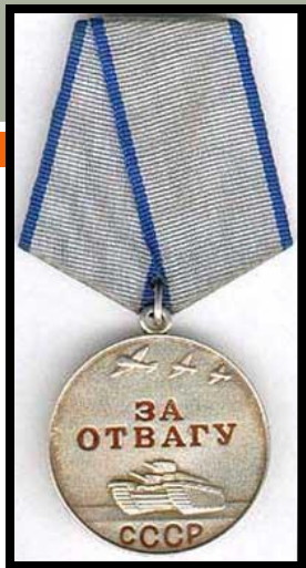
МЕДАЛЬ ЗА ОТВАГУ

Званием героя Советского Союза (посмертно)