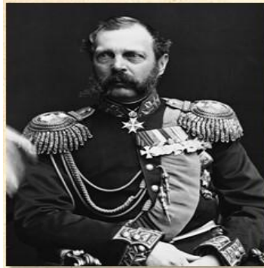
Император Российской империи Александр II