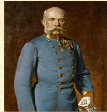
Император Австрийской империи Франц Иосиф I