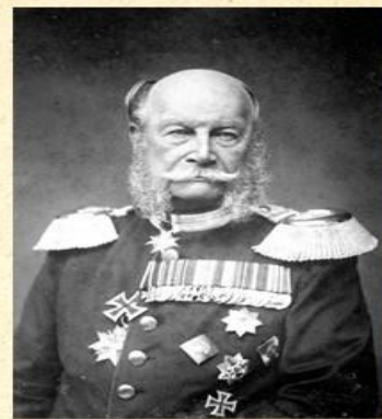
Император Германской империи Вильгельм I