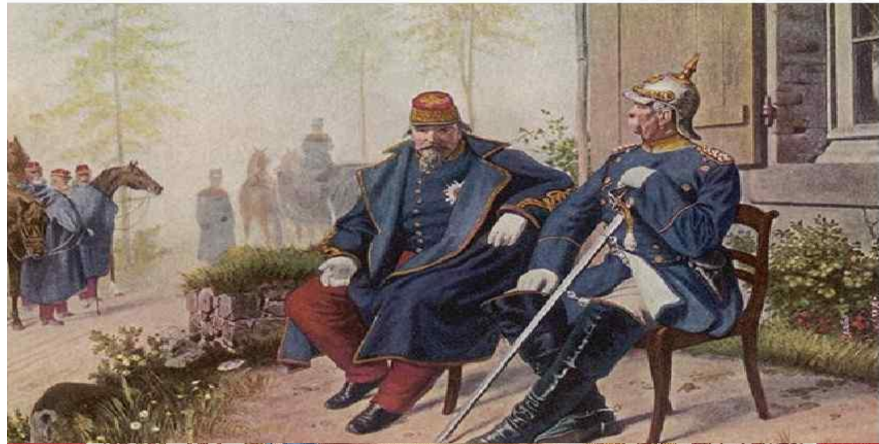
Наполеон III и Бисмарк после Седана