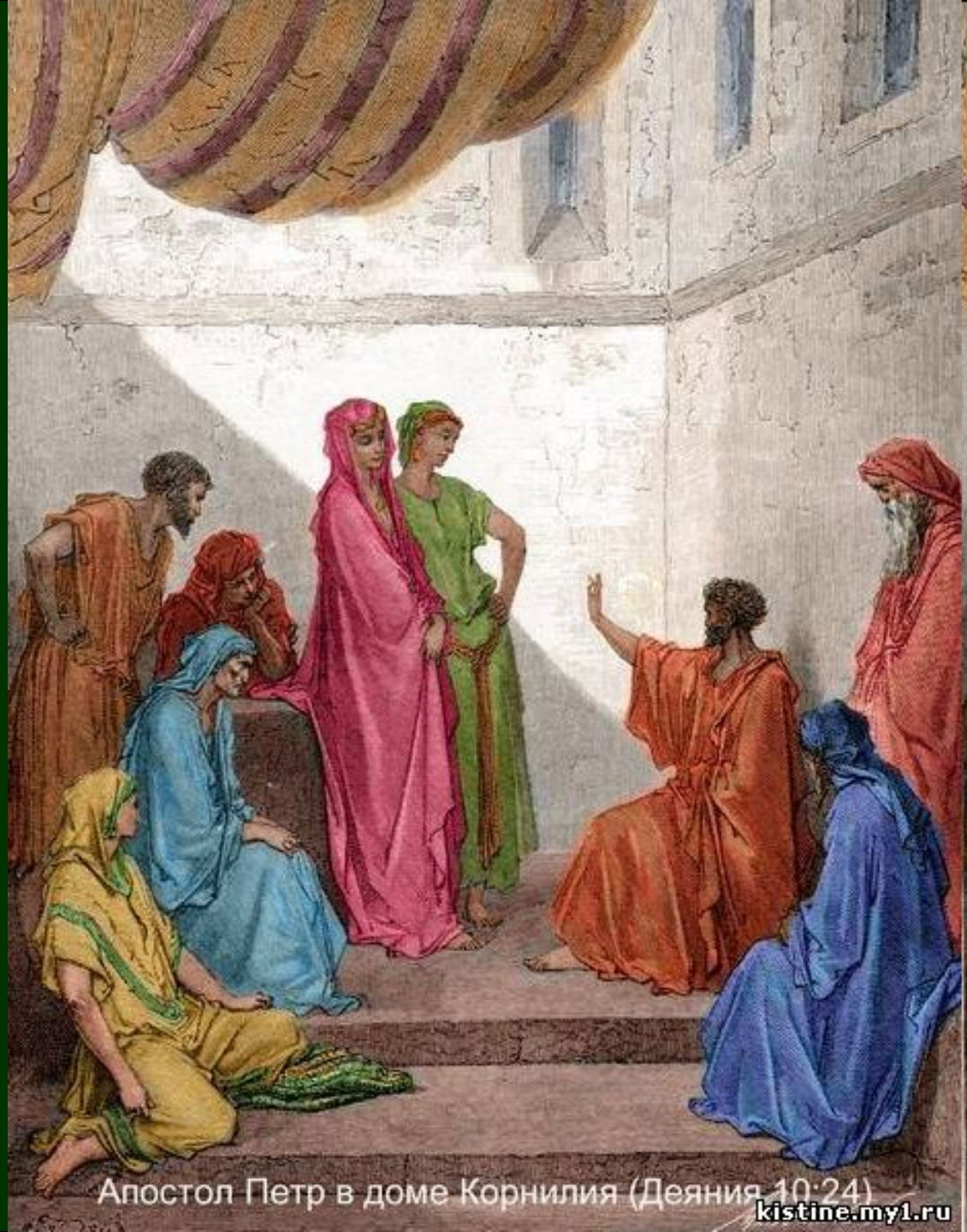
Апостол Петр в доме Корнилия (Деяния 10:24)