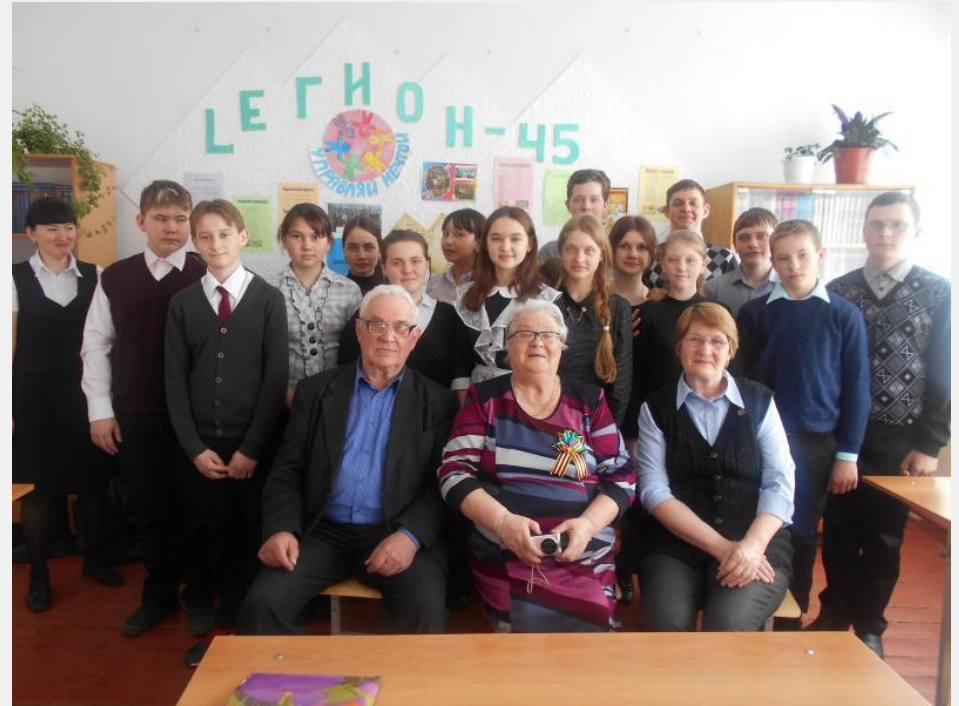
На встрече с ветеранами