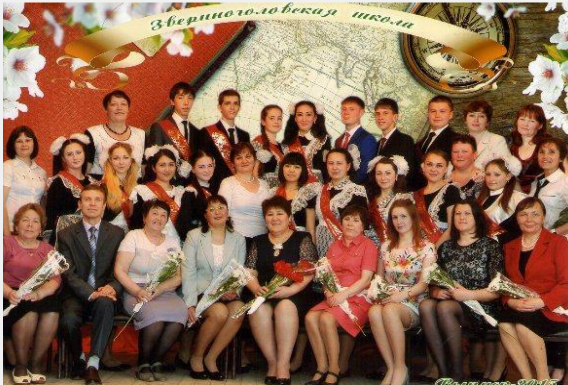
Учительский коллектив с выпускниками 2015 года