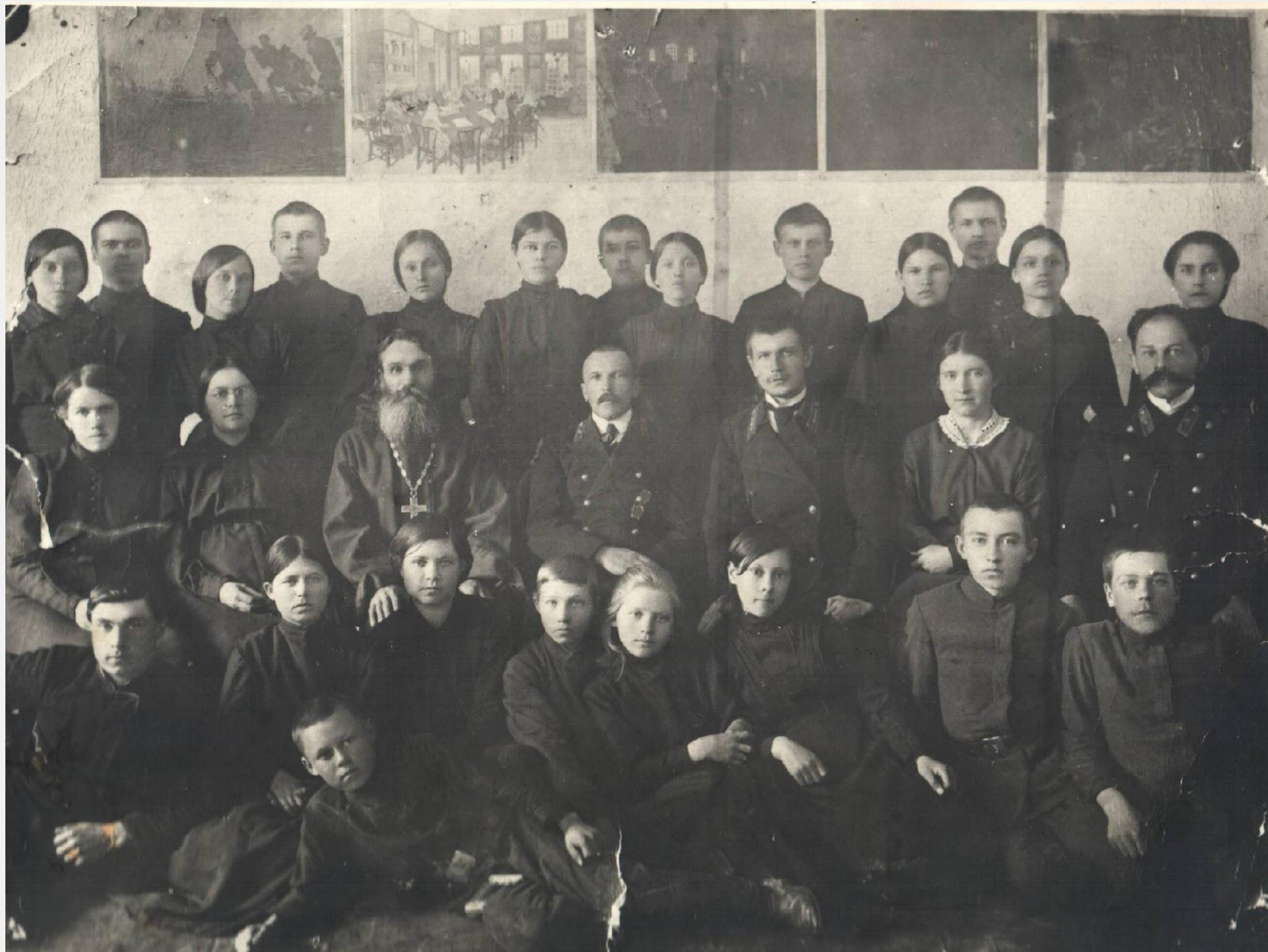
Учительский коллектив с выпускниками 1916 года