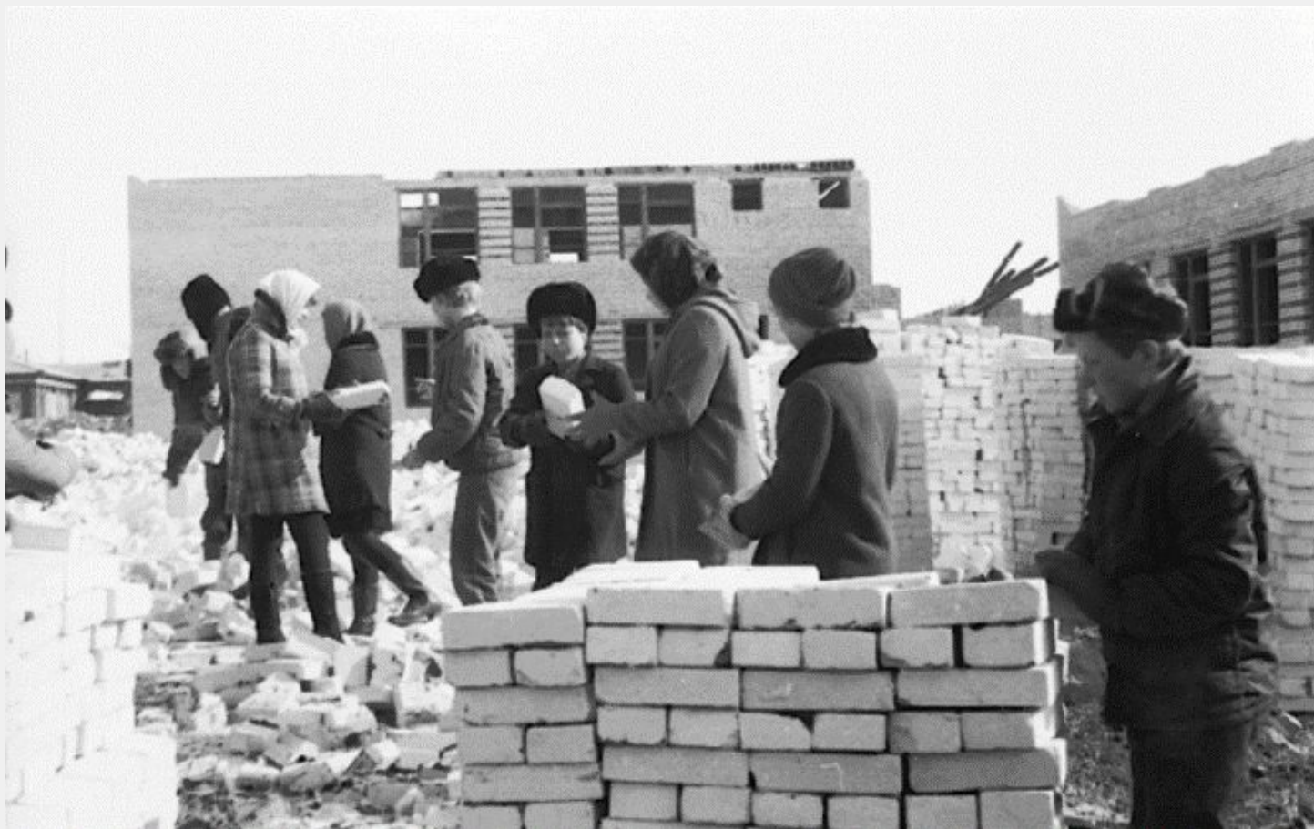
Ученики школы трудятся на строении новой школы