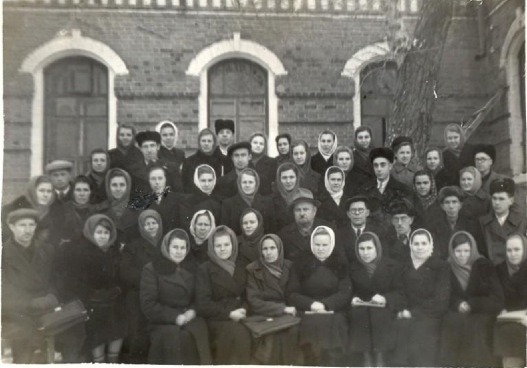
Учительский коллектив 1956 год