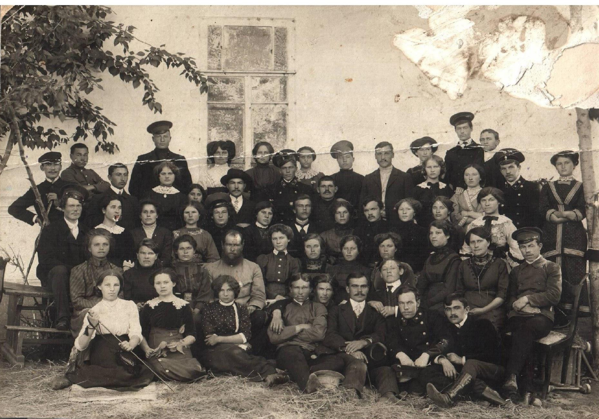
Учительский коллектив с учениками 1912 года