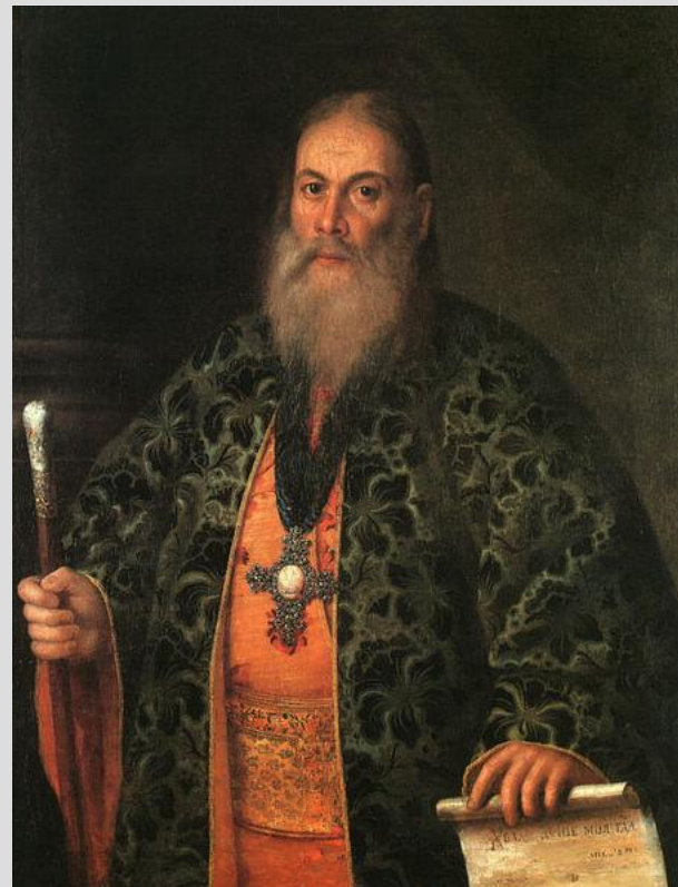
А. Антропов «Протоиерей Фёдор Дубянский»

Протоиерей обычно является настоятелем храма.