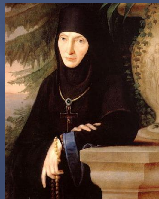
Спасо-Бородинский женский монастырь