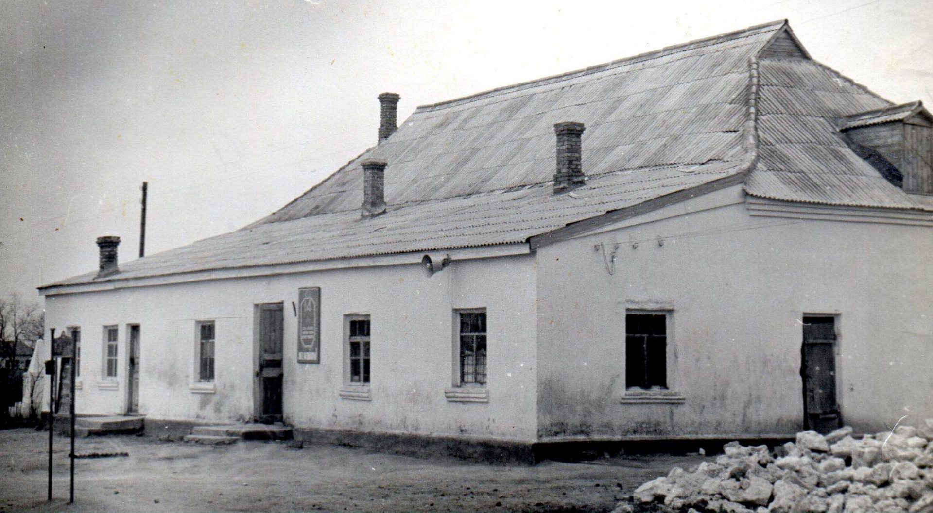
◆ Клуб села Виноградное